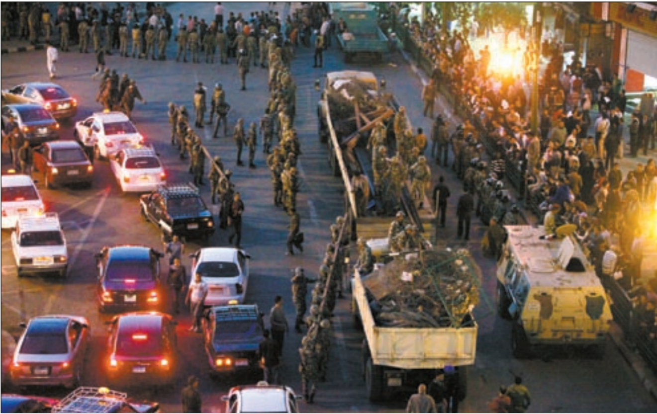
القوات المسلحة المصرية تخلي ميدان التحرير بعد 5 أيام من الاعتصام فيه (رويترز)

قرار سيخذه بعد قبوله لرئاسة الحزب الوطني الجديد هو فصل جميع فلول الحزب الوطني وقياداته بداية من الرئيس السابق حسني مبارك وأتباعه العام اول من امس. الى ذلك، أعلن طلعت السادات، ابن شقيق الرئيس المصري الراحل أنور السادات وعضو مجلس الشعب السابق، أن أول