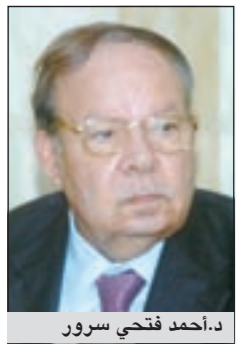
د. أحمد فتحي سرور

القاهرة - ي.ب.ب. أي: ايدت محكمة جنايات القاهرة في مصر امس قرارى النائب العام وجهاز الكسب غير المشروع بشأن التحفظ على أموال رئيس مجلس الشعب المنحل د. أحمد فتحي سرور وزوجته وأولاده. ورفضت هيئة الدفاع عن سرور قرار التحفظ على أمواله وأسرتها، مؤكداً أنه جمع ثروته من عمله في السلطات التشريعية والقضائية وإيضاً من خلال عمله كأستاذ جامعي ومحافظ ورئيساً للبرلمان العربي والأفريقي.