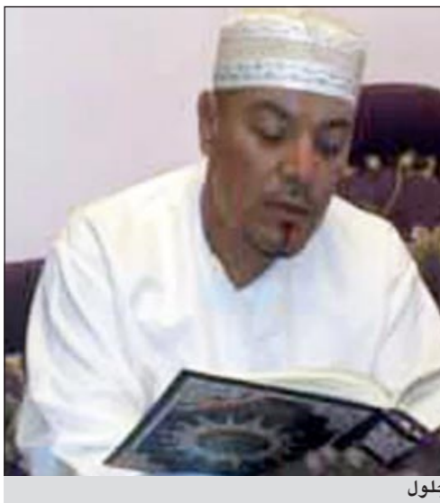
المنشد الجزائري جلول

القاهرة - ام.بي.سي: قال المنشد الجزائري الشهير جلول إنه لن يتراجع عن مشروعه الفني الذي أطلق عليه «أسلمة»، فن الراي، مشيراً إلى أنه يؤدي هو وغيره من الفنانين كلمات مهينة ترضي الله وترضي الذوق كلمات مهذبة ترضي الله، وقال: «الغناء عن مشاكل المجتمع والشباب والمناسبات السعيدة يمكن أن يؤدي بطريقة راقية».