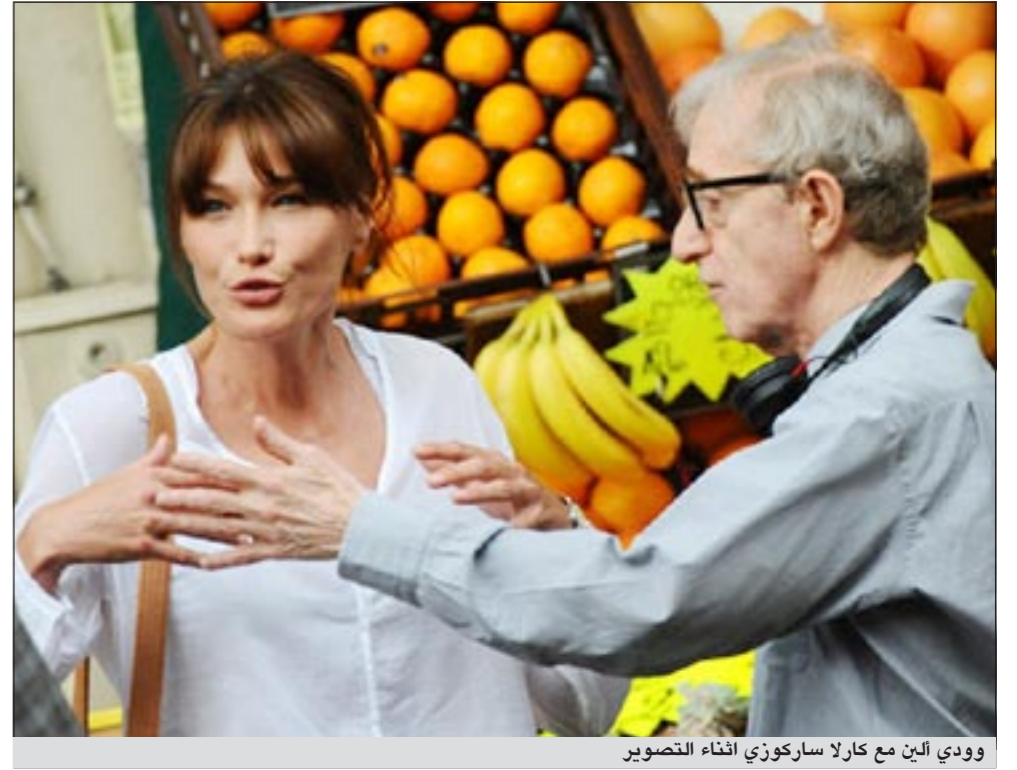
ودي ألين مع كارلا ساركوزي أثناء التصوير

يشار إلى أن كارلا قامت بدور البطولة الثانية في فيلم منتصف الليل في باريس الذي قام ببطولته راشيل مكدامز وأوين ويلسون.