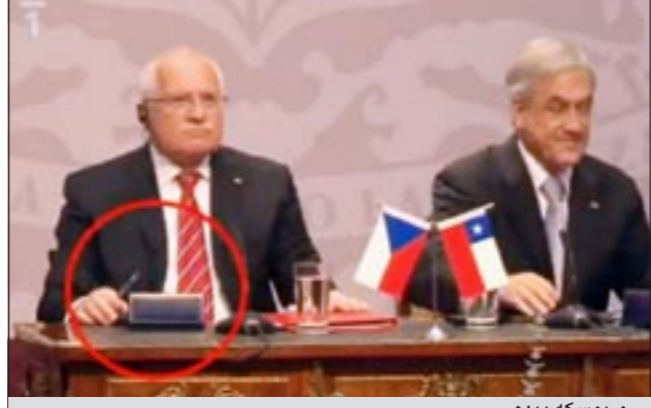
..و يمسكه بيده

إلى ذلك، علق المخرج المساعد في العمل والمبدع الفني للأغنية، لوريان غيبسون، قائلاً ان: «الأغنية ستغير العالم».