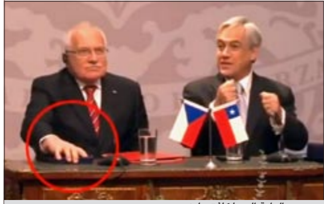
..ويعيد اللعبة إلى ما كانت عليه