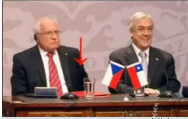
..ويبعد أن أخفاه