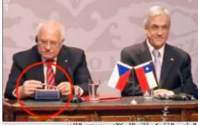
الرئيس التشيكي فاتسلاف كلاوس يسحب القلم