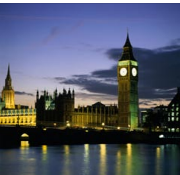
لندن مقصد السائحين

ويشير الدليل السياحي للمدينة إلى وجود العديد من صور الفنون في الشوارع وثقافة الحانات، ولكن بشكل عام، تقدم المنطقة هدايا تذكارية وقمصان تي شيرت ومجوهرات بأسعار مرتفعة.