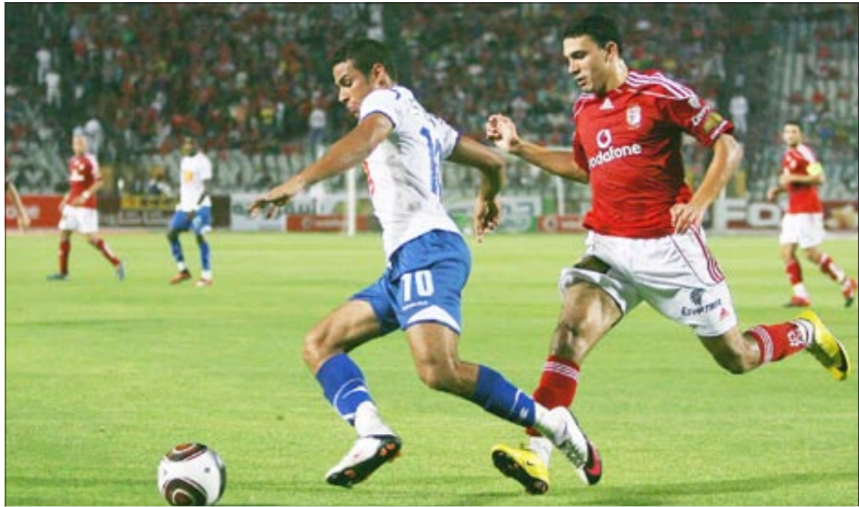
الأهلي يامل في عودة قوية أمام اتحاد الشرطة بعد التوقف الطويل