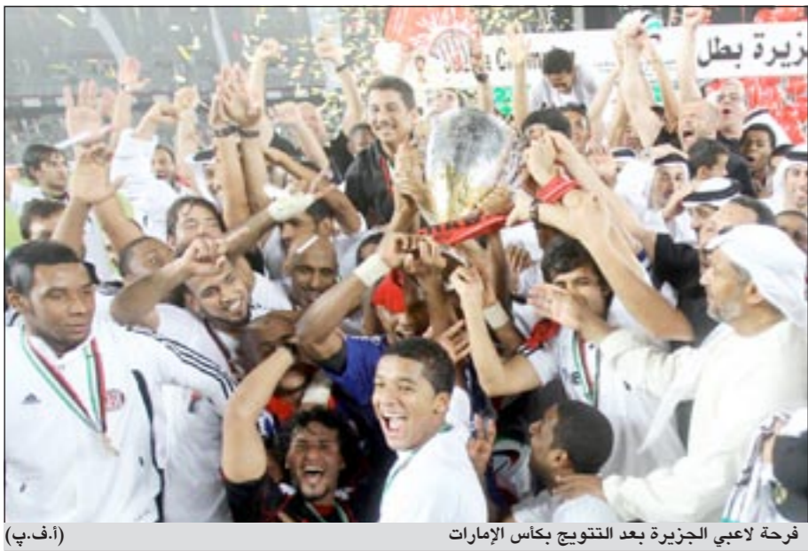
فرحة لاعبي الجزيرة بعد التتويج بكأس الإمارات

سعيد بعد ركلة حرة من اسماعيل مطر سكنت مرعى على خصيف لكن الحكم ألغاه بداعي التسلل (22).