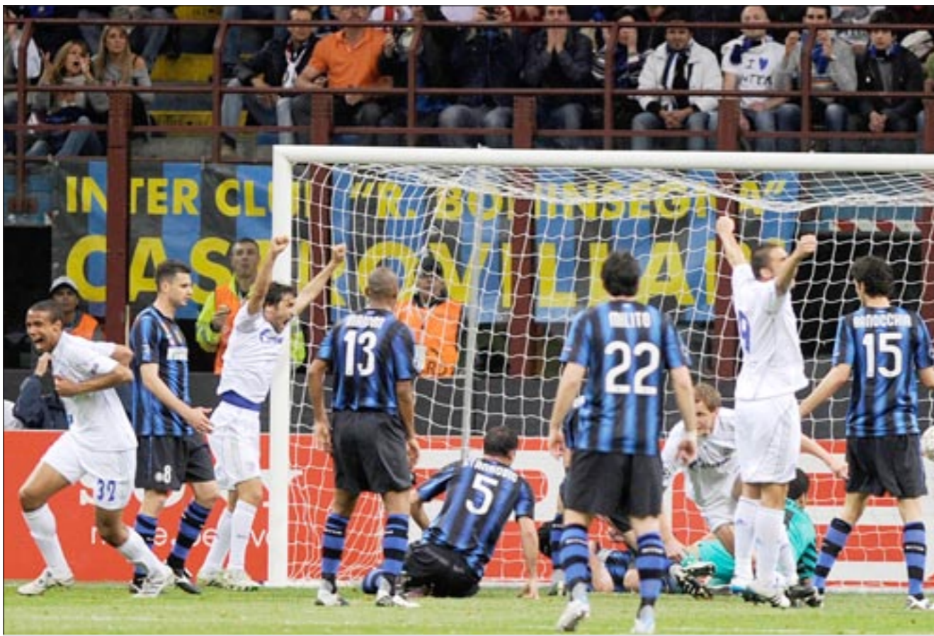
فرحة لاعبي شالكة بهدف راوول في مرمى إنتر ميلان في مباراة الذهاب