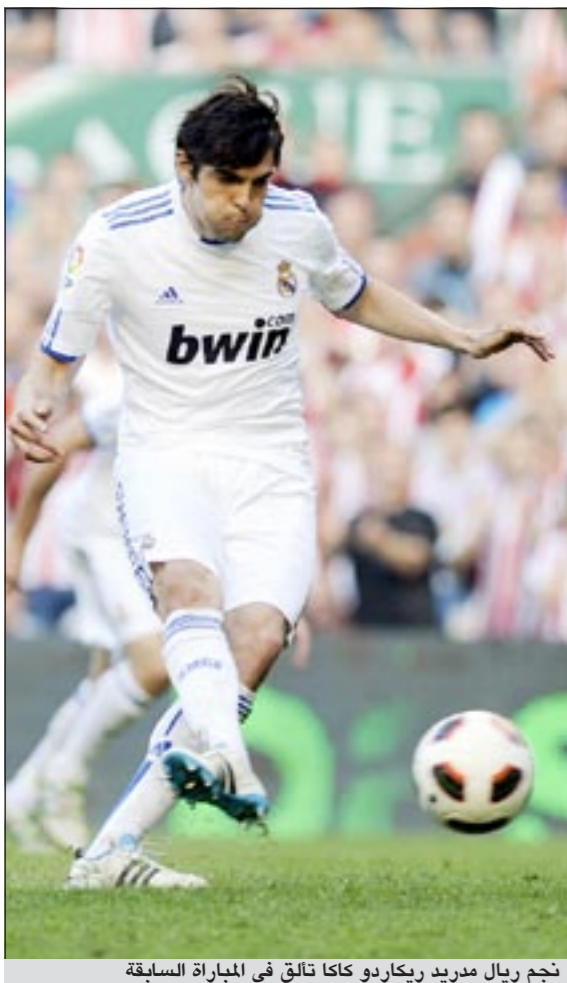
نجم ريال مدريد ريكاردو كاكّا تالق في المباراة السابقة

سعادة كبيرة إذا فازت بهذه البطولة، التي وصفها بـ «أقوى بطولة كرة قدم في العالم. وقد تنغاضى عن الإخفاق في أي بطولة أخرى أقل شأنا»، مضيفا: «أتدنى أن أنني مسيرتي بالفوز بدوري الأبطال ولو لمرة واحدة على الأقل، ولكنني لست متلهفا عليها». وعاد مورينيو ليحرب عن فخره بالتواجد في النادي الملكي وكونه أحد أفراد نادي القرن الـ20، متعهدا بمواصلة المشوار نحو الألقاب رغم اعترافه بان «البدية لم تكن إصابات التكررة على أنها مجرد تظاهر أو ادعاء لأنني أريد الانتقال من ريال مدريد. لكن هذه الشائعة لا أساس لها من الصحة، على الإطلاق». وأضاف «إنني سعيد بوجودي هنا، أريد أن أتاعف وأن أعود لقمة مستواي من أجل الفوز بالعديد من الألقاب مع ريال مدريد». وأعرب كاكّا عن أمه في أن «تصبر» جماهير ريال مدريد عليه خلال فترة تعافيه. كانت شائعات عدة رشحت كاكّا، أفضل لاعب في العالم سابقا، للعودة إلى ميلان من جديد أو للانتقال إلى جاره إنتر ميلان أو تشلسي الإنجليزي. يحل ريال مدريد غدا الأربعاء ضيفا على فريق توتنهام الإنجليزي في إياب دور الثمانية لبطولة دوري أبطال أوروبا، بعدما حسم مباراة الذهاب على ملعبه بالفوز 4 - 0.