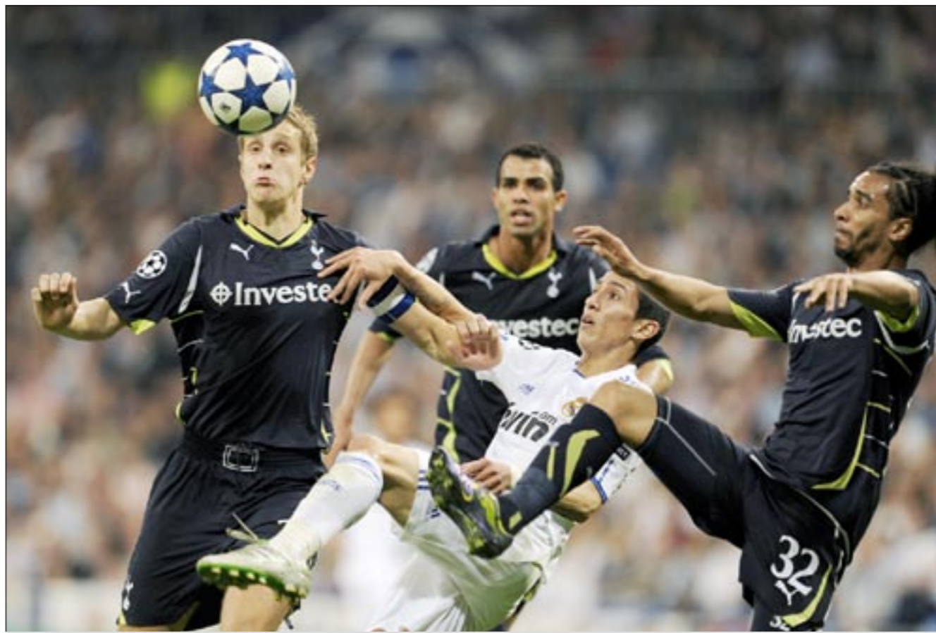
مهاجم ريال مدريد الأرجنتيني أنخل دي ماريا تالق في مباراة الذهاب أمام توتنهام وهنا محاصرًا وسقط 3 لاعبين

الناس. الفوز في دوري الإبطال له تأثير قوي على الجماهير. لغاية نهاية مسيرتي ساحول الفوز فيها مرة جديدة لكن دون أن يصبح هذا الأمر هاجسا لي». وقال حارس مرمى ريال الدولي إيكير كاسياس الساعي أيضا للقبه الثالث بعد 2000 و 2002 «يبدو أننا سننتاهل الى الدور الثاني، لكن امامنا مسارات الأياب». هذا وسبقا للفائز من مباراة شالكة وانتز الفائز من مواجهة تشلسي ومان يونايتد الإنجليزيين، ومن جهة أخرى سبقا للفائز من مواجهة ريال مدريد وتوتنهام الفائز من مواجهة برشلونة الإسباني وشاختر دانينيتسك الأوكراني.