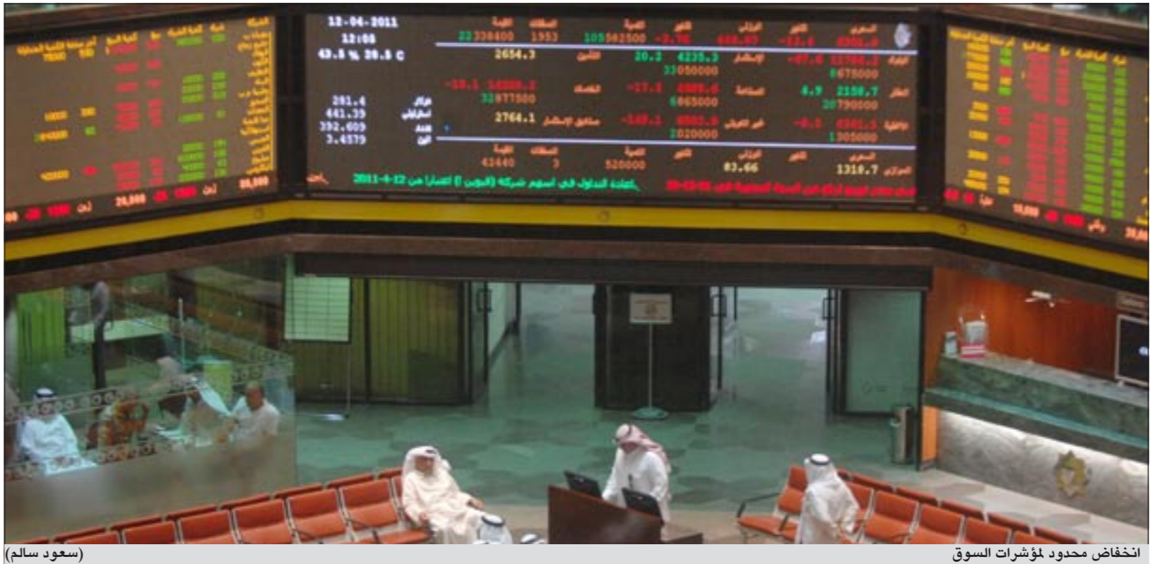
انخفاض محدود مؤشرات السوق

السهم بيتك بقوة مقارنة ببول من امس الا ان سعره السوقى سجل ارتفاعا محدودا.