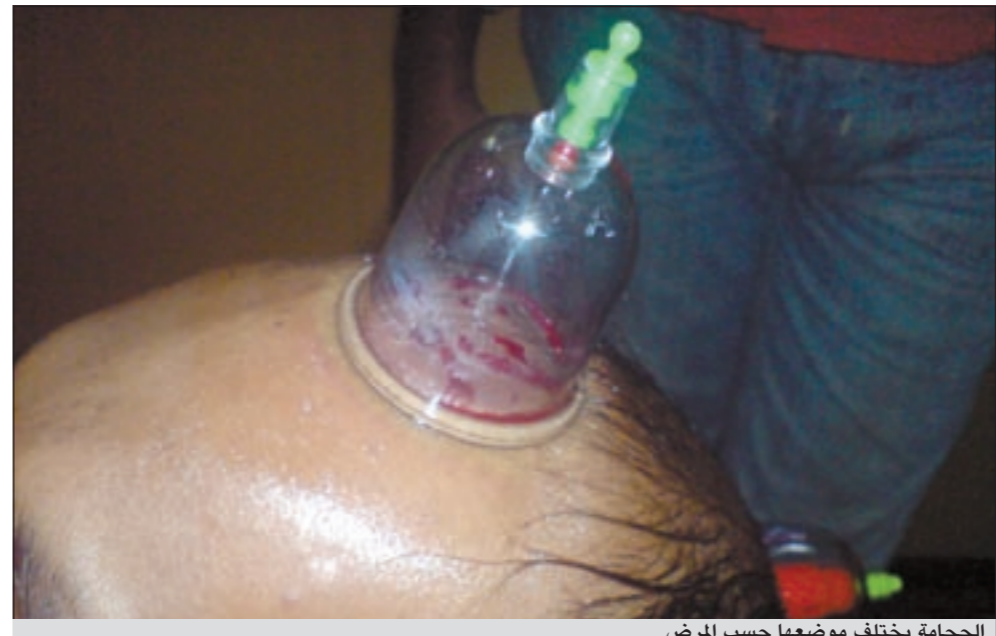
الحجامة تختلف موضعها حسب المرض

وكذلك الأعصاب تلعب دوراً رائداً في حياة الإنسان وأغلب ما يعاني المشاكل هم الأشخاص العصبيون الذين تسهل إثارتهم والمسببات تختلف من شخص لآخر فهناك أشخاص يتمتعون بالهدوء الشديد وفجأة حياتهم تتغير بشكل عكسي فيتحولون للتقيض وأغلب إصابة الأشخاص بالعصبية تكمن في وتيرة الحياة والعلاج يكون بالبحث عن المسبب خلال الفترة التي لم يكن يعاني الشخص فيها من التعصب والبحث ممارساته اليومية والبحث فيما إن كان المريض يعاني من ضغط نفسي أو إن كان شخص لا يضع نظاماً ونمطاً لحياته يشتمل على الرياضة ونظاماً غذائياً صحياً أو معتدلاً وكذلك رصد ساعات النوم وإن كان يعاني من أرق أو يسهر لساعات طويلة، كذلك ضغوط الأهل أو العمل أو ازدحام الطرق فكل هذه الأمور قد تصيب الناس بحالات عصبية وموجات غضب شديدة وهنا يستطيع الشخص أن يكون طبيب نفسه بمحاولة