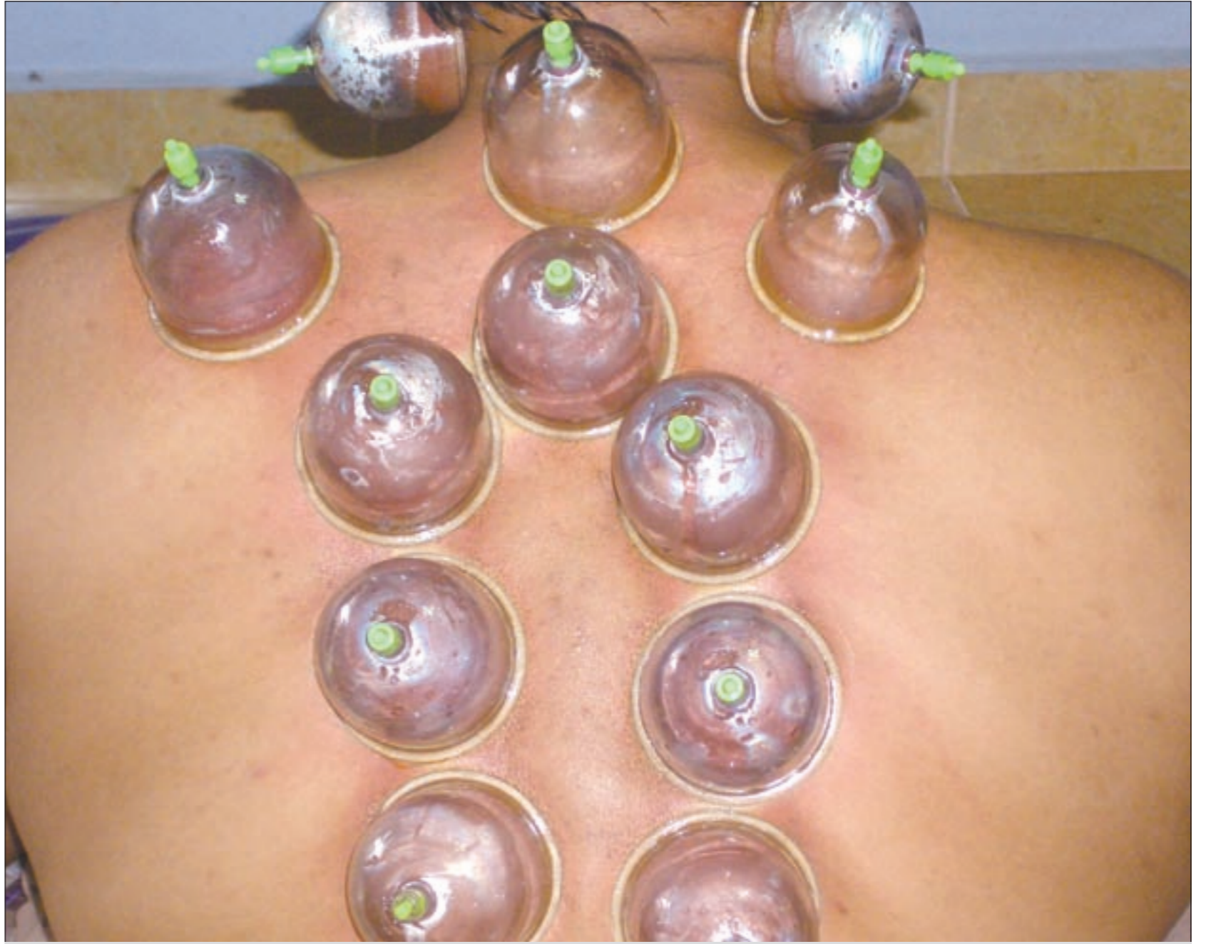
الحجامة تنشط الدورة الدموية وتخلص الجسم من السموم

يخفف الجرعة أو يوقفها سواء لمريض الضغط أو السكري كما أن على المريض أن يراقب نفسه ويلاحظ ما يضره وما ينفعه فالأطعمة التي نتناولها لا تؤثر في كل شخص بنفس القدر حتى وإن كان يعاني من المرض نفسه فالمانجو والآناس وغيرهما قد لا ينصح مريض السكر بتناولها ولكن البعض يتناولها دونما أن ترفع السكر لديه وكذلك عسل النحل الذي يجب أن يتناوله مريض السكر، فهناك أنواع من العسل مفيدة جداً لمرضى السكر.