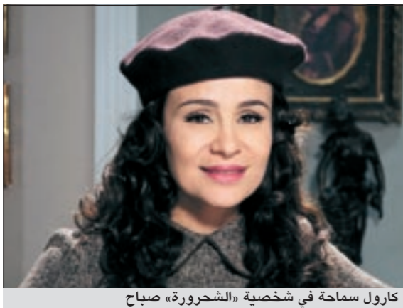
كارول سماحة في شخصية «الشحرورة» صباح