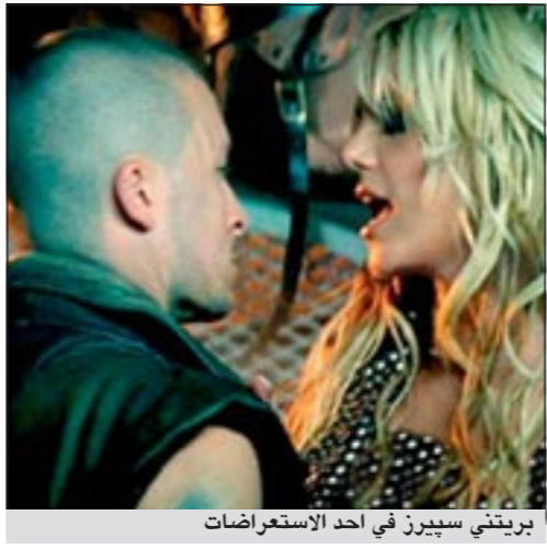
بريتني سبيرز في أحد الاستعراضات

إم.بي.سي: اتهم البعض مغنية البوب الشهيرة بريتنى سبيرز بالاستعانة برجل للقيام بدور البديل لها (دوبلير) في تصوير أغنيها الجديدة «حتى نهاية العالم». فقد أصبح المقطع الترويجي للأغنية حديث رواد شبكة الإنترنت حول العالم، بعد أن شك أحد المشاهدين في تادية رجل بعض الخطوات الراقصة بدلا منها.