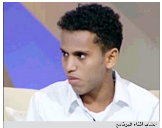
الشباب أثناء البرنامج

دبي - ام بي سي: استضاف برنامج «كلام نواعم» شابا عجز عن استخراج أوراق هوية له في الكويت، بعد أن رفض أبوه وأمه الاعتراف به، وأصبح معلقا بلا هوية، ترفض المدارس تعليمه، وترفض المستشفيات استقباله للعلاج، في حلقة خصصت لمناقشة مشكلات من فقدوا والديهم، واللقطاء. فقد تناولت حلقة الأحد قضية اللقطاء في العالم العربي وما يدور حولها من جدل ومشكلات في مختلف نواحيها الاجتماعية والقانونية، وكيفية التعامل مع المحرومين من الأب والأم وحساسيتهم النفسية تجاه المجتمع.