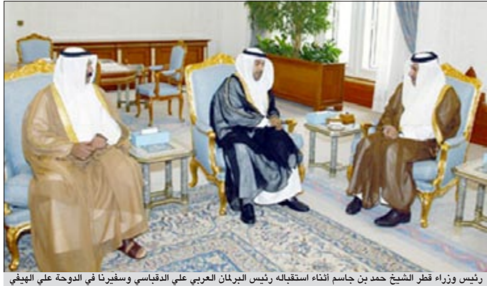
رئيس وزراء قطر الشيخ حمد بن جاسم أثناء استقباله رئيس البرلمان العربي علي الدقباسي وسفيرنا في الدوحة علي الهيفي