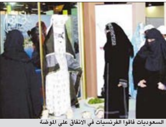
السعوديات قافوا بالفرنسيات في الإنفاق على الموضة