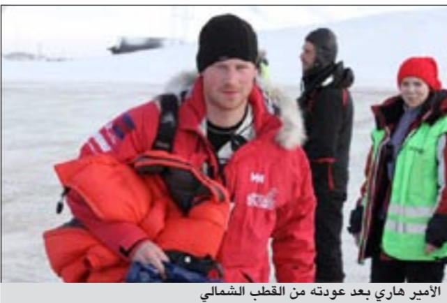
الأمير هاري بعد عودته من القطب الشمالي

لندن - د.ب.أ: أكد المتحدث باسم قصر سانت جيمس ان الأمير هاري عاد سالماً إلى بريطانيا بعد المشاركة في رحلة سير خريبة مع جنود الجيش البريطاني من مصابي العمليات إلى القطب الشمالي.