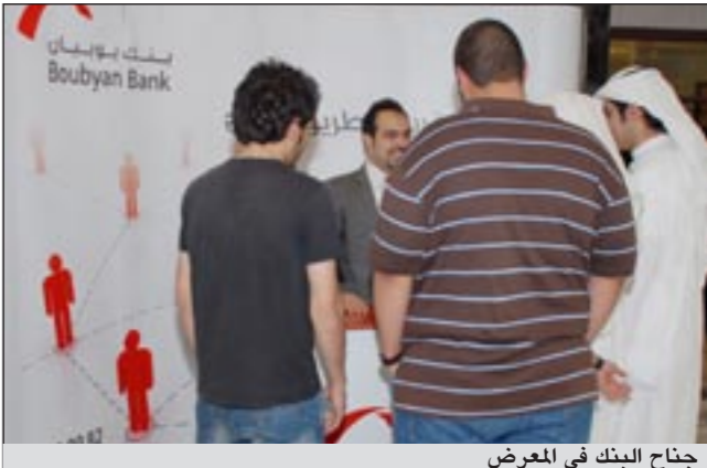
جناح البنك في المعرض

وكان البنك قد رعى مؤخرا معرض «صناع الاقتصاد وفرص العمل» السادس عشر ومعرض «أسبوع الحياة المالية المصغرة» بالإضافة إلى معارض أخرى وأنشطة تهم قطاع الشباب.