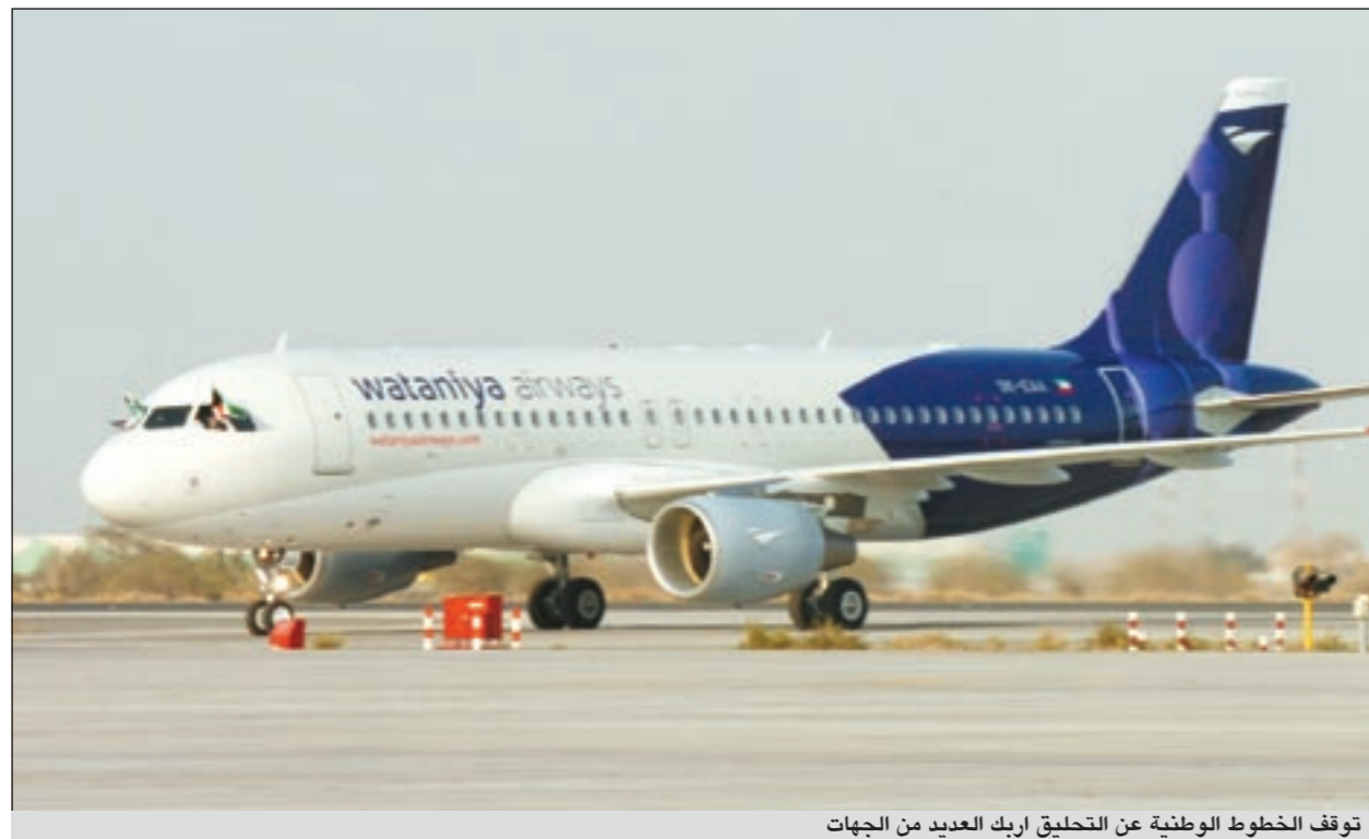
توقف الخطوط الوطنية عن التحليق أربك العديد من الجهات

التي درسها المجلس منذ وقف عملياتها في 16 مارس الماضي. وأضافت المصادر أن مجلس الإدارة فشل في التفاوض مع مستثمر استراتيجي لزيادة رأس المال بقيمة 15 مليون دينار، حيث لم يتم التوصل إلى حلول مرضية للطرفين، الأمر الذي يجعل الشركة أمام خيار التصفية الإجبارية. وقالت المصادر إن هناك اجتماعات مستمرة مع شركة «الافكو» من أجل التفاوض على قيمة المطالبات التي تقدر بنحو 70 مليون دولار والواقعة على