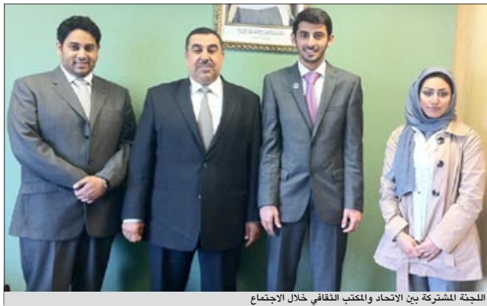
اللجنة المشتركة بين الاتحاد والمكتب الثقافي خلال الاجتماع