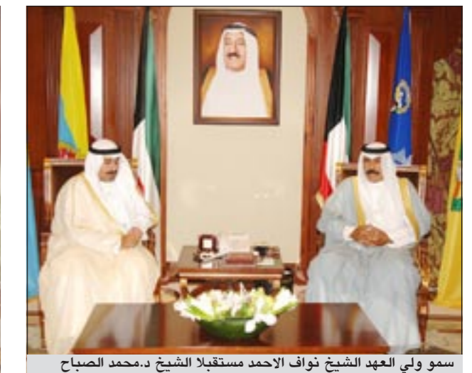
سمو ولي العهد الشيخ نواف الاحمد مستقبلا الشيخ د.محمد الصباح

حضوره حفل التخرج السنوي الموحد لجامعة الكويت للعام الأكاديمي 2009 - 2010 الذي سيقام الساعة السادسة والنصف مساء اليوم على استاد الرياضي في الشويخ.