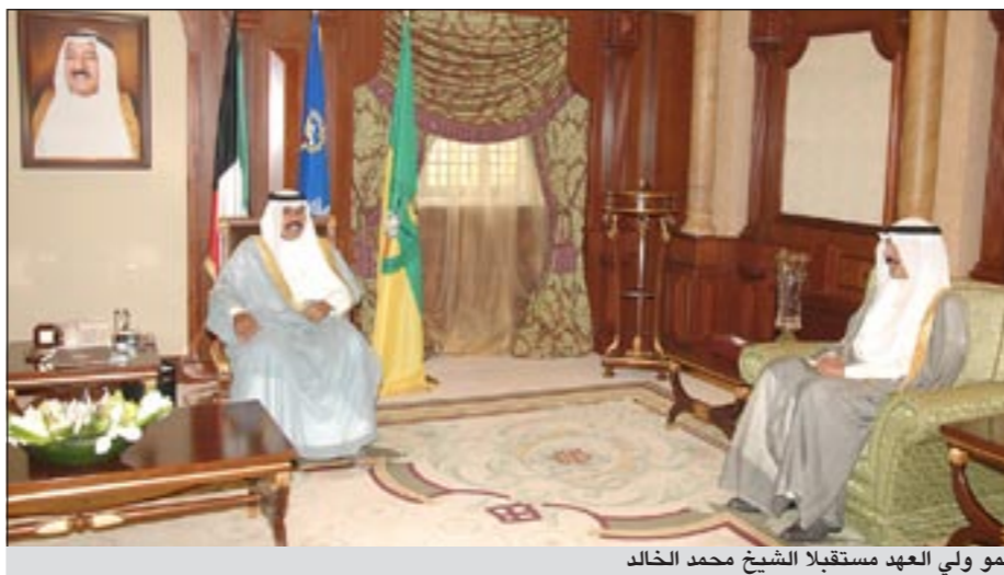
سمو ولي العهد مستقبلا الشيخ محمد الخالد