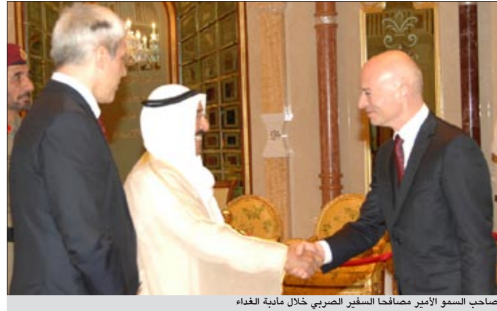
صاحب السمو الأمير مصافحا السفير الصربي خلال مأدبة الغداء

استقبل صاحب السمو الأمير الشيخ صباح الاحمد بقصر بيان صباح أمس سمو ولي العهد الشيخ نواف الاحمد.