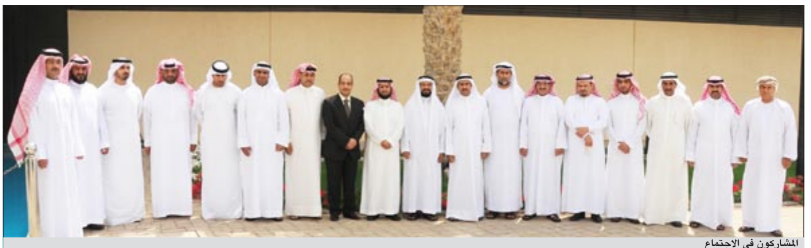
المشاركين في الاجتماع

العربية ولتنسيق الجهود بين القوات البحرية والأجهزة الأمنية المختصة والجهات ذات العلاقة بالأمن البحري.