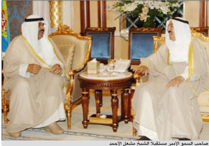
صاحب السمو الأمير مستقبلا الشيخ مشعل الأحمد