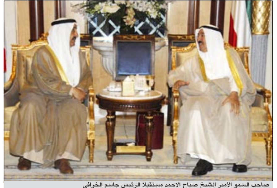
صاحب السمو الأمير الشيخ صباح الاحمد مستقبلا الرئيس جاسم الخرافي

صاحب السمو استقبل ولي العهد والخرافي ومشعل الأحمد والمحمد ورئيس مجلس النواب البحريني