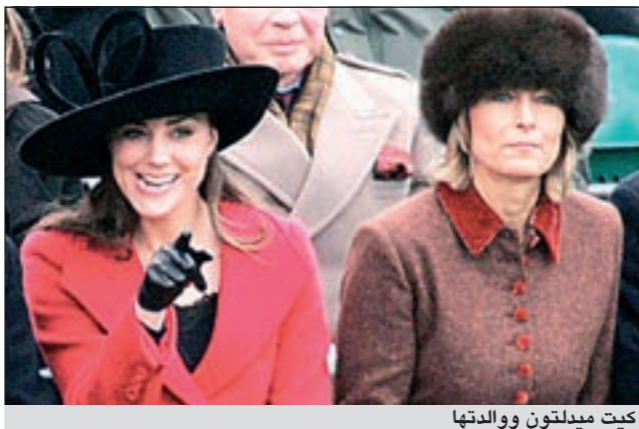
كيت ميدلتون ووالدتها

يطاردها صائدو صور. وستزوج كيت ميدلتون من الأمير وليام الثاني في ترتيب خلافة العرش في إنجلترا بحضور نحو 1900 مدعو في 29 الجاري، وهو الزواج الأهم في إنجلترا منذ زفاف الأمير تشارلز والليدي ديانا والدي الأمير وليام.