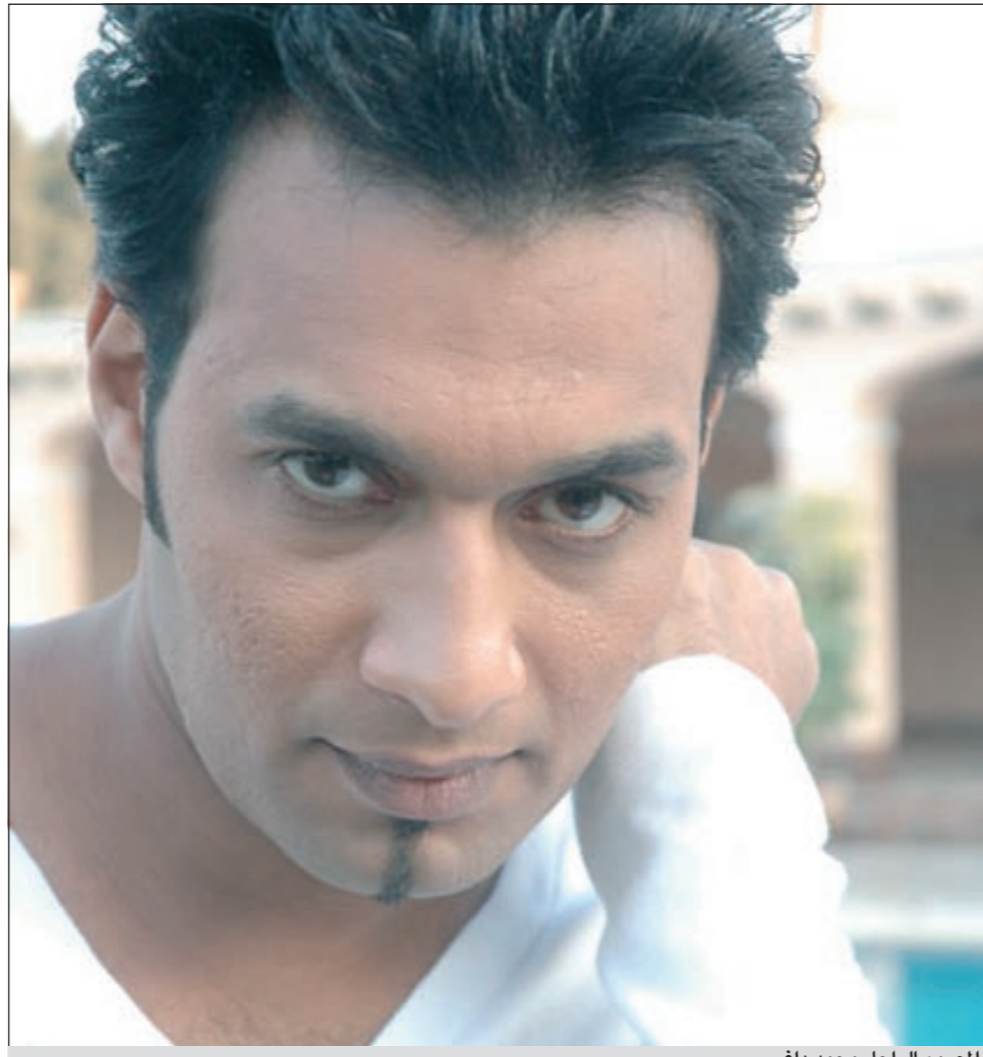
المصمم الراحل محمد داغر

القاهرة - د.ب.أ: ألقت أجهزة الأمن المصرية امس الاول القبض على قاتل مصمم الأزياء المصري محمد داغر.