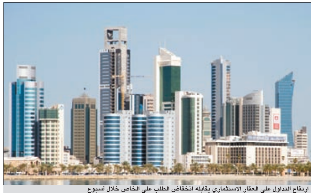
ارتفاع التداول على العقار الاستثماري يقابله انخفاض الطلب على الخاص خلال اسبوع

والشريط الساحلي بواقع عقار 33 عقاراً فيما ارتفع مؤشر العقار الاستثماري بواقع (عقار واحد)، علماً ان مؤشر تداول الوكالات العقارية استقر بواقع صفر عقار بالنسبة للعقارين «التجاري» و«المخازن».