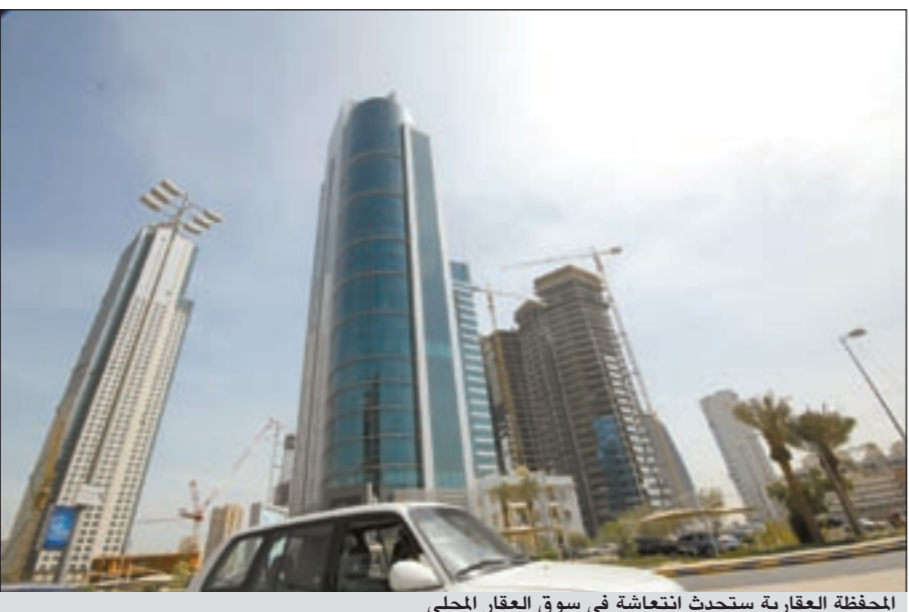
المحفظة العقارية ستحدث انتعاشة في سوق العقار المحلي