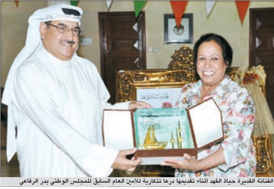
الفنانة القديرة حياة الفهد أثناء تقديمها درعا تذكارية للأمين العام السابق للمجلس الوطني بدر الرفاعي

كما أنها فرصة لتسليط الضوء على مراحل مهمة من حياة فلسطين والتي يجسدها المسلسل بما يشبه الوثيقة.