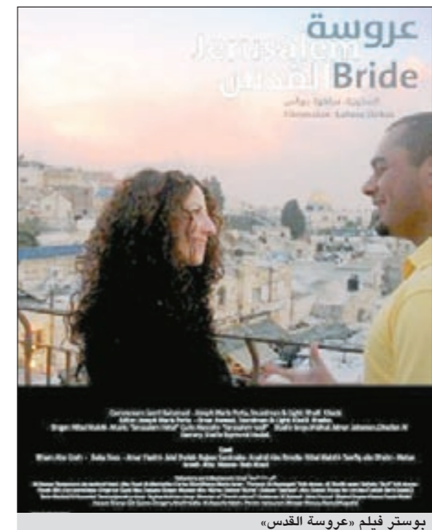
پوسٲر فيلم «عروسة القدس»

وأوضحت درياس أن هذا الفيلم الذي ساهم الكثير من سكان البلدة القديمة في تكاليف إنتاجه من خلال توفير أماكن التصوير والتطوع للعمل فيه استغرق عاماً ونصف العام من البحث والإعداد التقني خلالها مع عاملة اجتماعية استمعت منها إلى العديد من القضايا في مدينة القدس ومنها انتشار المخدرات وظروف السكن الصعبة والانتظار فيها ومنع السكان من إضافة غرف جديدة لبيوتهم «في الوقت الذي يتمكن المستوطنون من إضافة طوابق جديدة على البيوت القديمة».