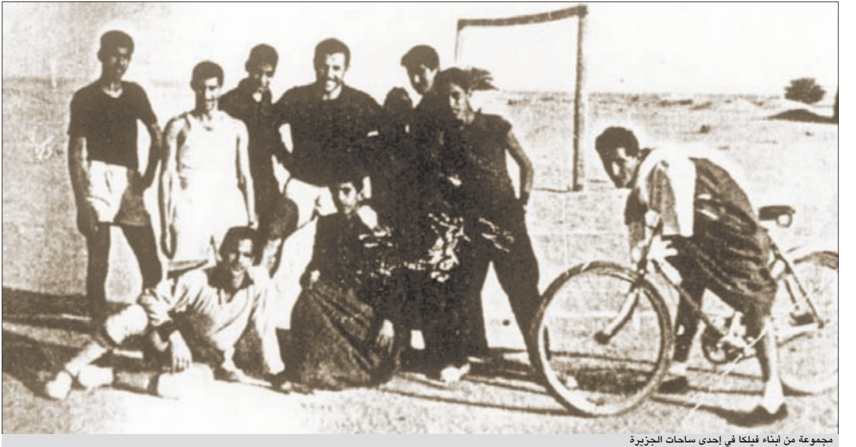
مجموعة من أبناء فيلكا في إحدى ساحات الجزيرة

وعن دواوين العائلة يقول: عائلة مال الله حاليا عندنا عدة دواوين موزعة على أيام الاسبوع وتقريبا موزعة على المناطق السكنية واذكر منها: ديوانية في منطقة الشهداء، ديوانية في منطقة الزهراء، ديوانية في منطقة حطين، ديوانية في منطقة السرة، ديوانية في منطقة الروضة، ديوانية في منطقة قرطبة، ديوانية في منطقة اليرموك، وديوانية السرة الرئيسية حاليا في قطعة 4، كما كان عندي ديوانية في السرة تجمع العائلة والأصدقاء، ولعدم وجود مواقف بعث البيت وحاليا عندي ديوانية كل يوم ثلاثاء.