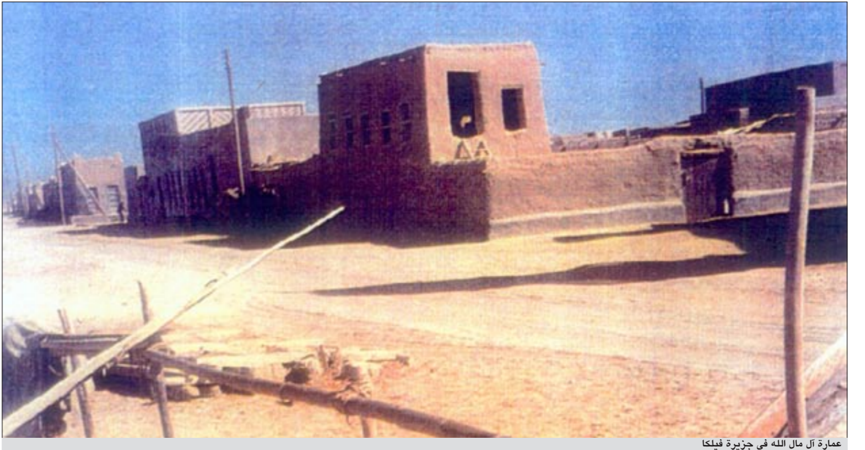
عمارة آل مال الله في جزيرة فيلكا

مال الله فكان مفتوحا طوال اليوم اربعة وعشرين ساعة، وكان من الدواوين المشهورة في جزيرة فيلكا ونستقبل الضيوف من الدول العربية، وكل شيء يجهز لهم. كذلك ديوان الحمدان وديوان شعيب. قال مال الله يملكون المزارع