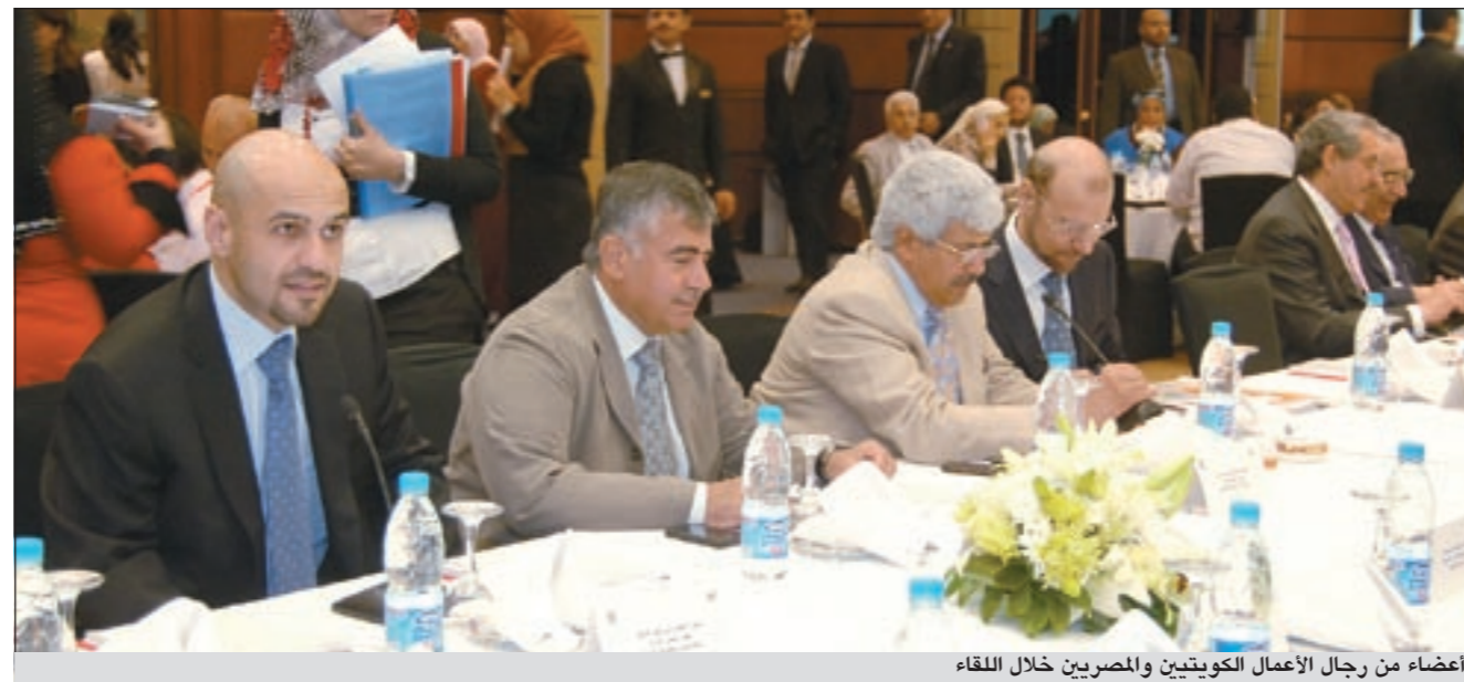
أعضاء من رجال الأعمال الكويتيين والمصريين خلال اللقاء

أقامه البنك الوطني المصري على شرف الوفد الاقتصادي الكويتي الذي زار مصر بحضور نائب رئيس مجلس إدارة بنك الكويت الوطني ناصر مساعد السامر وكبار الشخصيات والقيادات الكويتية والمصرية، أن «البنك الوطني المصري حقق نتائج قياسية في العام الماضي، حيث ارتفعت أرباحه الصافية بنحو 10,3٪ إلى