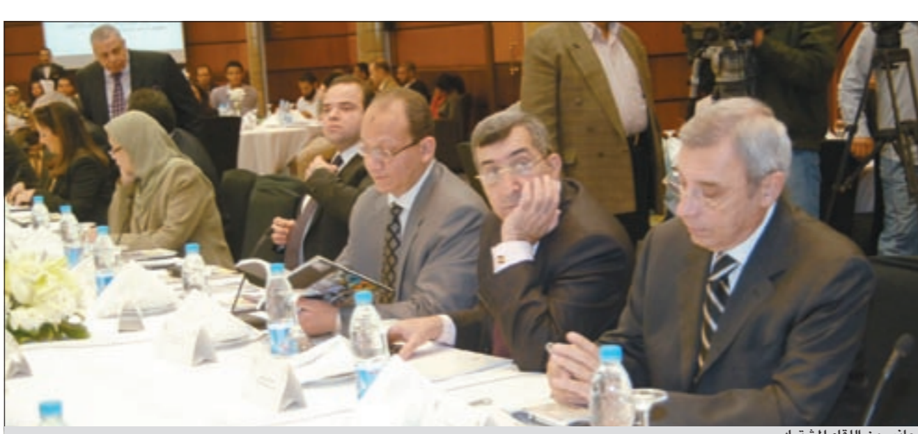
جانب من اللقاء المشترك