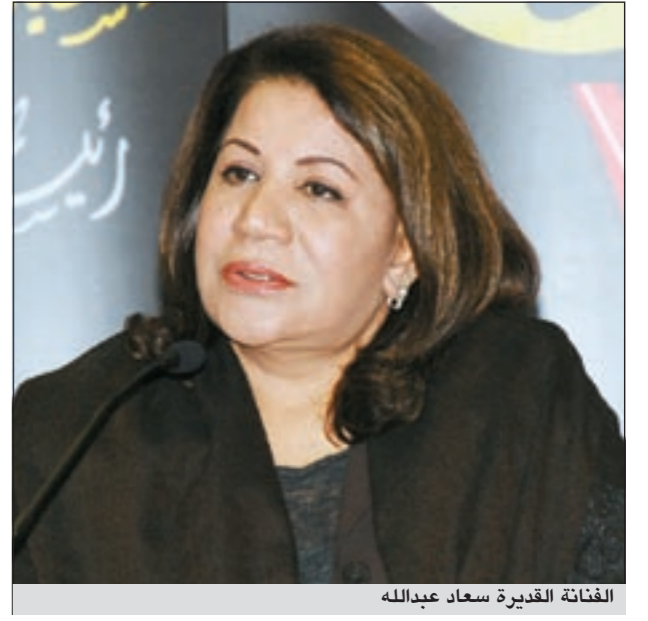
الفنانة القديرة سعاد عبدالله

وجد الفنان، خالد أمين، صالته التي ترصيه وتشيعه كفتان في دور «المكفوف» من خلال مسلسل «الفرصة الثانية» مع الفنانة القديرة سعاد عبدالله، واعتبر الاستاذ الاكاديمي في المعهد العالي للفنون المسرحية أن تلك الادوار المعقدة والمتعبة تستنزف الموهبة داخل أي فنان ويعتبرها تحدياً يجذبها ليخوضه.