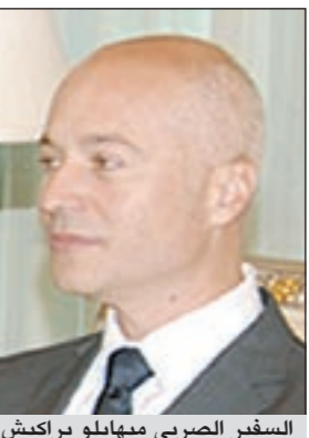
السفير الصربي ميهابيلو براكيش

القوات القذافي لقمع المتظاهرين، وأكد انها اتهامات غير صحيحة ووزارة الدفاع الصربية نفت ذلك رسميا. وحول آفاق المفاوضات بلاده وكوسوفو والتحضير لدخول الاتحاد الأوروبي أوضح السفير الصربي ان «هذه المفاوضات بدأت قبل اسابيع ونتعتقد ان النتيجة النهائية ستكون مقبولة لكلا الجانبين، ونتيجة الفوز من شأنها ان توفر حولا طويلة الأمد وشاملة لتجاوز سوء التفاهم بين الشعبين الصربي واللباني في كوسوفو، مضيفا: نتوقع ان أوروبا تساندنا في محاولة الوصول لهذا الحل. التفاصيل ص 2