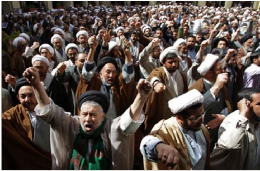
رجال دين إيرانيون في مدينة مشهد ينتفضون ضد ما أسموه التدخل السعودي في البحرين

وأضاف: «نعتقد أن مشاكل البحرين باعتبارها بلداً مستقلاً يجب أن تحل عن طريق التفاهم داخل أسرة البحرين نفسها، وأنه ليس من المصلحة إشعال نار أزمة في المنطقة».