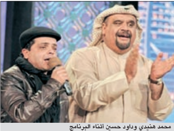
محمد هندي وداود حسين أثناء البرنامج

يستضيف النجم داود حسين في الحلقة الثانية من برنامج «فاصل وتعود مع داود» على قناة دبي والتي ستبث بعد غد «السهرة»، النجم الكوميدي محمد هندي في لقاء ليس الأول بينهما، حيث جمعهما الفيلم السينمائي «عندليب الدقي»، ولكن في البرنامج الجديد تسيطر أجواء الكوميديا الساخرة ليتحدث هندي عن مراهقته الذي بدأها يوم الأحد وفي الصباح تحديدا، كما يخص جمهور قناة دبي بذكريات طفولته وعلاقته بوالده وأسرتة التي كان لها القرار الأكبر في تحديد علاقته بالمسرح، في الوقت نفسه يكشف النجم المصري عن حقيقة الأستاذ «رمضان أبو العلمين»، فيما يناقش مع داود ضياع اللغة العربية بروح لا تخلو من الكوميديا، مؤكدا من وجهة نظره أن المبالغة في الإفراط الهذلية حقيقة مستوحاة من واقع حياتهم اليومية.