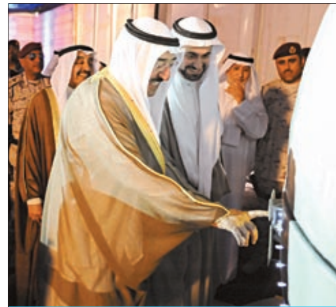
صاحب السمو الأمير الشيخ صباح الأحمد يضغط زر مجسم ميناء مبارك الكبير ايثانا بتدشين المشروع صاحب السمو وضع حجر أساس ميناء مبارك الكبير في جزيرة بوبيان 16 إلى 18

استبقت الكتل البرلمانية اعلان التشكيل الحكومي الجديد بتأكيد جاهزية استجواباتها وتحديد مواعيد تقديمها فور أداء الوزارة القسم الدستوري ودون انتظار لبرنامج الحكومة. وما ان بدأ سمو رئيس الوزراء الشيخ ناصر المحمد مشاوراته الرسمية امس لاختيار