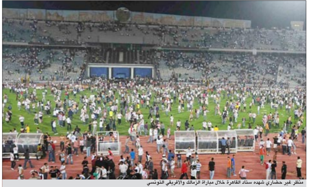
منظر غير حضاري شهده ستاد القاهرة خلال مباراة الزمالك والأفريقي التونسي

سيؤولي فرانكو كولومبا مهمة الإشراف على بارما الإيطالي حتى نهاية الموسم بدلاً من باسكوالي مارينو الذي أقيل من منصبه الأحد الماضي. وكان من المفترض أن يتولى كولومبا (56 عاماً) تدريب بولونيا خلال الموسم الحالي من الدوري الإيطالي لكن إدارة النادي تخلت عن خدماته قبل يومين على انطلاق البطولة. أما بالتنسبة لمارينو، فهو أقبل من منصبه بعد أن مني بارما بهزيمة الثالثة على التوالي وجاءت على يد باري منديل ترتيب الدوري (2-1). ويحتل بارما الذي لم يذق طعم الفوز منذ 22 يناير الماضي، المركز السادس عشر في الدوري بفارق نقطتين عن تشيزينا الثامن عشر.