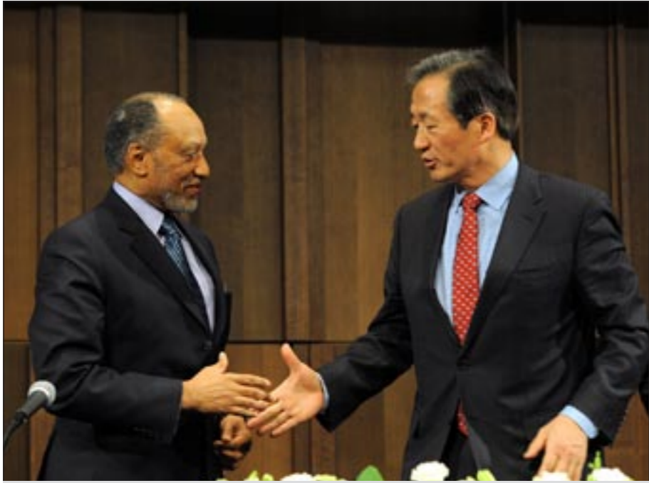
محمد بن همام يصادف تشونغ مونج - جون

في كوريا الجنوبية «خدم بلاتر فيفا كامين عام ورئيس لمدة 30 عاماً. حان الوقت الآن كي يترك الساحة لشخص آخر»، ووصف بن همام بأنه «الشخص المثالي ليحلب التغييرات والإصلاحات» إلى المنظمة الدولية. وكان بن همام الذي وصل إلى سيئول بعد رحلة إلى كوريا الشمالية وعد بتحويل الاتحاد الدولي إلى منظمة شفافة. ودعا بن همام إلى التضامن الآسيوي خلال حملته لمنافسة بلاتر على رئاسة «فيفا». وقال بن همام «الآن أنا مرشح ويمكنني القول إن الاتحاد الآسيوي لكرة القدم وآسيا هما المستقبل ليس فقط داخل الملعب ولكن خارجه أيضاً». وشدد بن همام على أن القارة الآسيوية ينبغي أن «تقف متحدة» خلف حملته للترشح لرئاسة الفيفا.