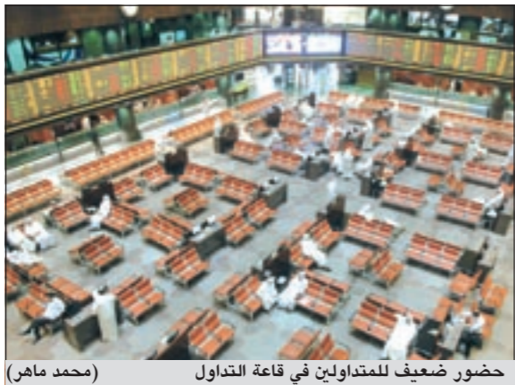
حضور ضعيف للمتداولين في قاعة التداول (محمد ماهر)

في السيولة المالية الموجهة للبورصة، وهذا يظهر ايضا مدى المخاوف التي تسود الأوساط الاستثمارية تجاه الوضع الاقتصادي للبورصة في ظل التجاهل الواضح من الجهات الحكومية للوضع