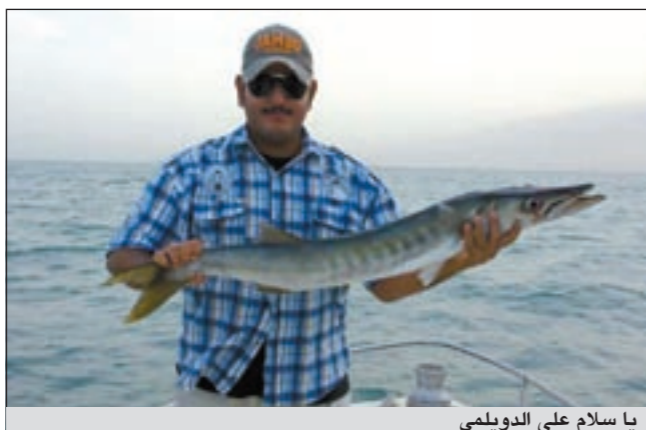
يا سلام على الدويلمي

وسرعة الطراد وحسب الغرز والسمكة التي ترغب في اصطيادها كل الذي ذكرته يأتي عن طريق أمرين رئيسيين وهما الخبرة والممارسة.