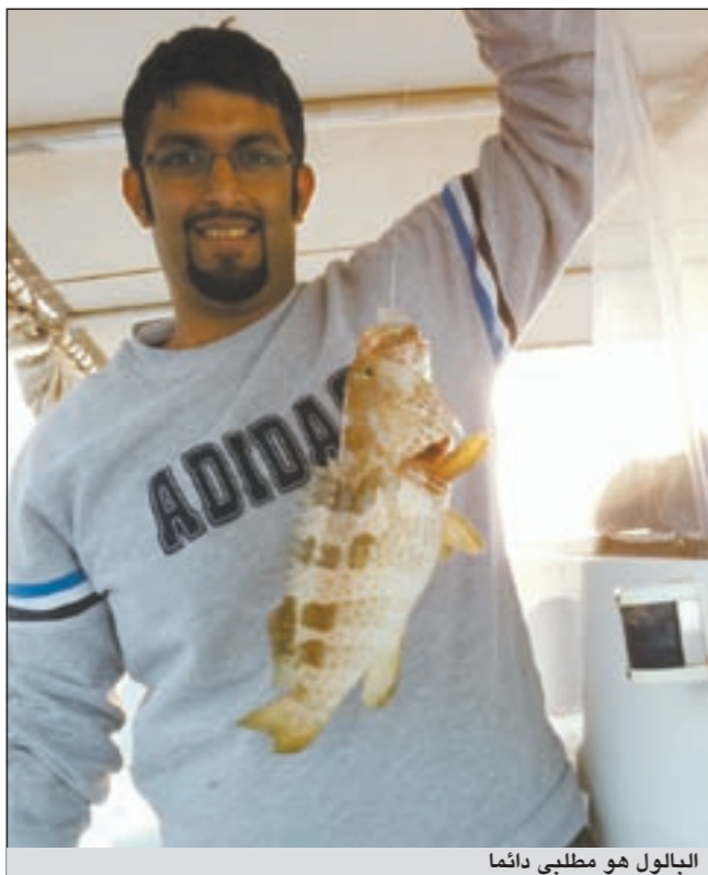
البالول هو مطلبي دائماً