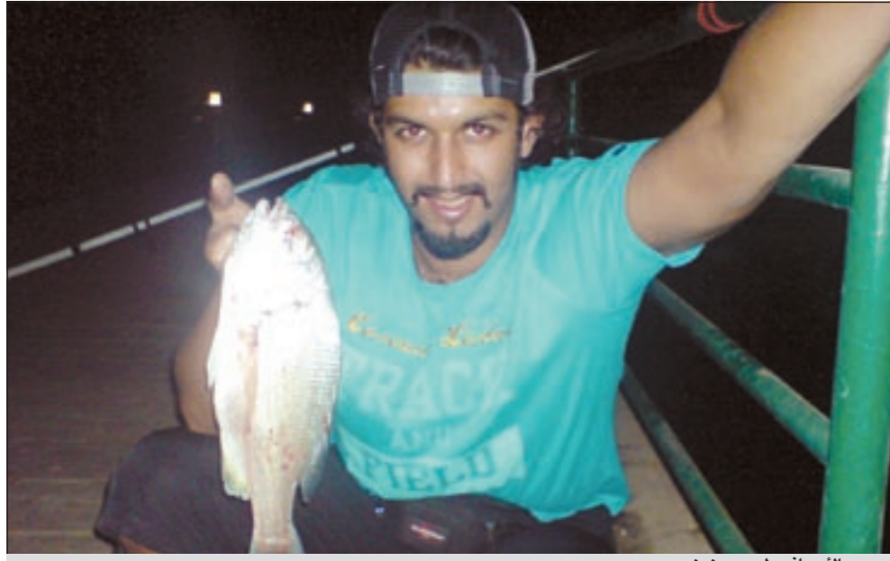
صيد الأسياف طيب «مزيزي»