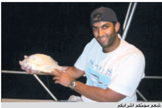
شعم منكم اشرايكم

الطلعة اولا تعتمد بالدرجة الأولى على حالة الجو والظروف التي قد تصادف أي شخص مثل المرض والسفر والعمل وغيرها وأنا اطلع ما بين مرتين وأربع طلعات بالاسبوع.