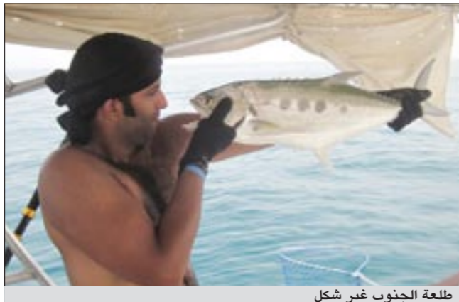
طلعة الجنوب غير شكل

● أحب أن أوجه دعوتي إلى كل مرتادي البحر والشاطئ بالمحافظة على بحرنا الغالي كما أوجه دعوتي إلى أخواني الحدائق وأرجو منهم الاهتمام بعدة السلامة والإسعافات الأولية كاملة دون نقصان وفي الختام أدعو للجميع بالصحة.