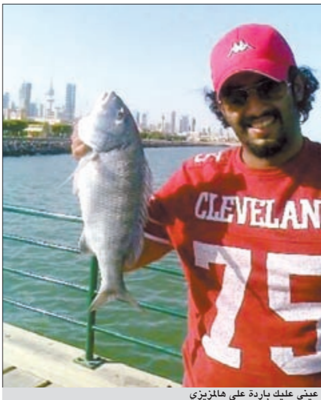
عيني عليك باردة على هالمزيزي