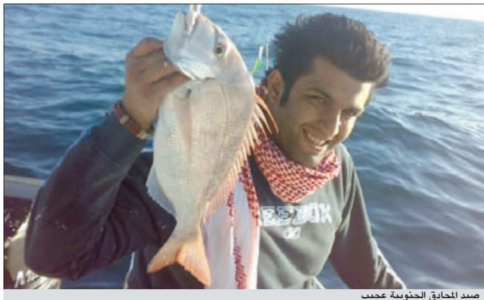
صيد الحدائق الجنوبية عجيب