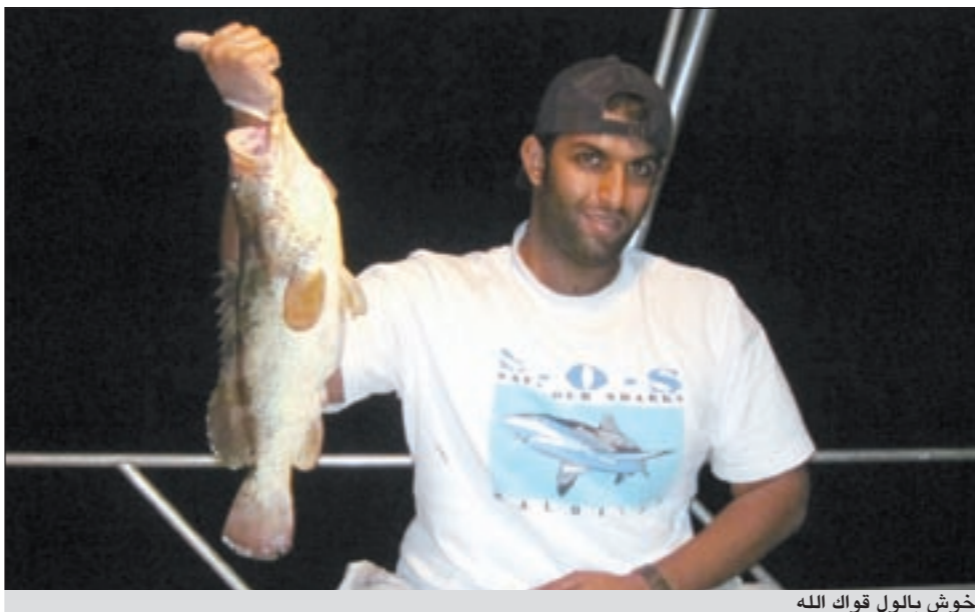
خوش بالول قواك الله