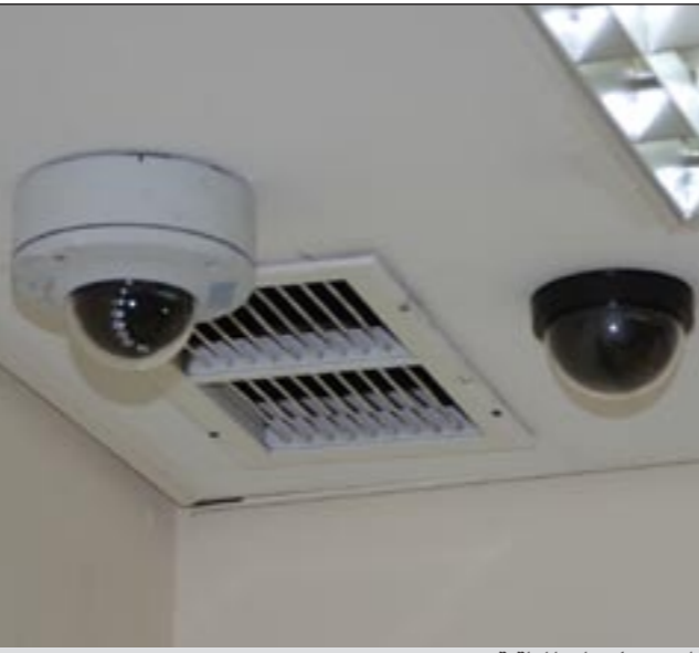
أحد كاميرات المراقبة