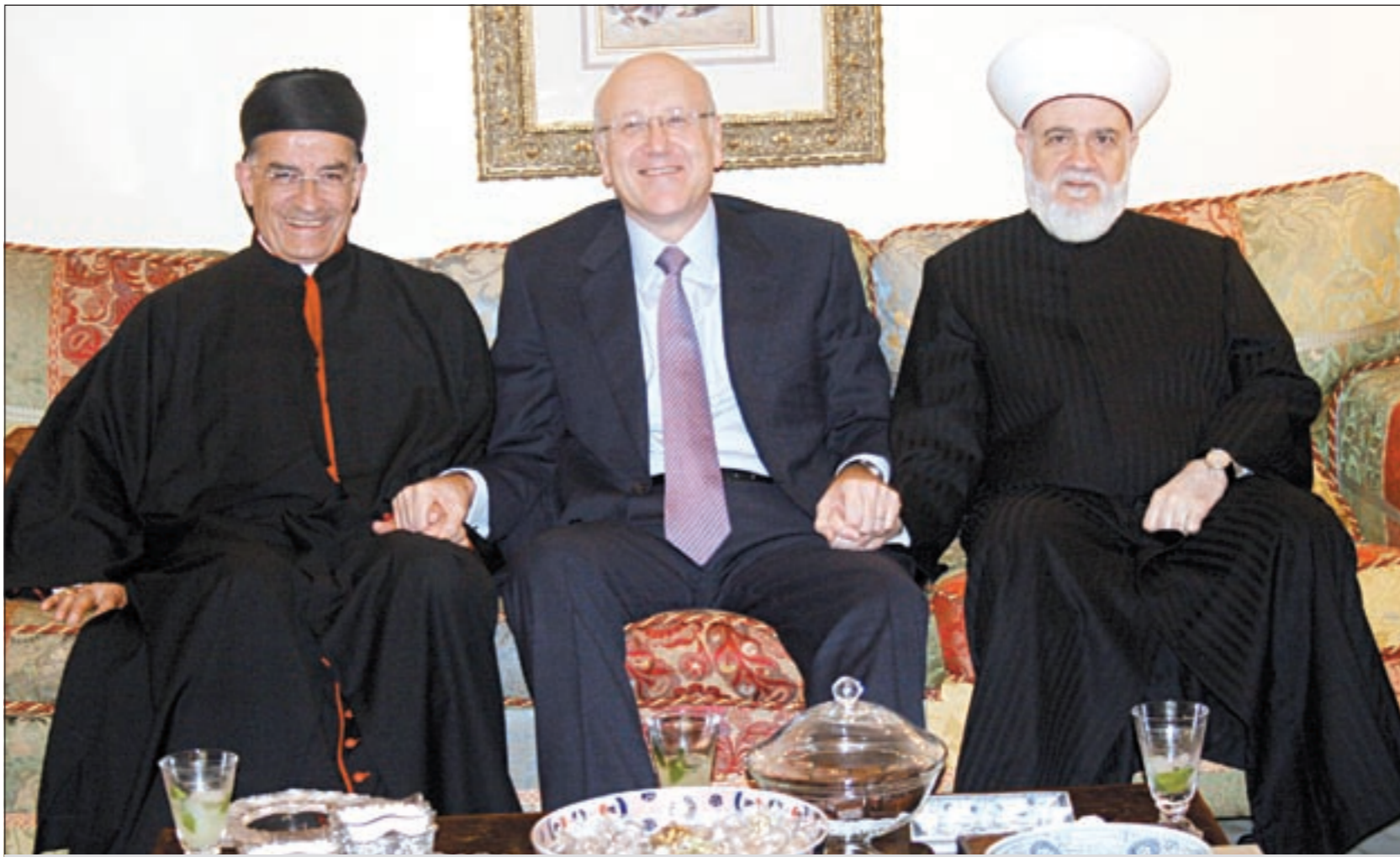
رئيس الحكومة المكلف نجيب ميقاتي متوسلاً مفتي لبنان الشيخ د.محمد رشيد قباني والبطريرك بشارة الراعي بمنزله في فردان

دخل لبنان اعتباراً من نهار أمس، الأسبوع العاشر على تكليف الرئيس نجيب ميقاتي بتشكيل الحكومة، فهل يكون الأسبوع الأخير في المشهد الحكومي، أم أننا أمام حبل من مسدود؟