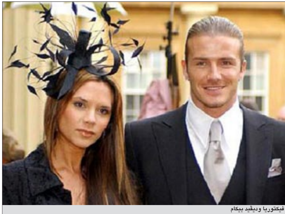
فيكتوريا وديفيد بيكام

لندن - أ.ف.ب: وجهت كيت ميدلتون دعوة إلى حبيبها الأول ويليام ماركس لحضور حفل زفافها على الأمير وليام وقالت صحيفة صاندي تليغراف إن كارلي ماسي بيرش أول حبيبة في الجامعة للأمير وليام ماتزال تنتظر دعوتها إلى حفل زفافه، وعلى النقيض من ماركس الذي كان أكثر نجاحا في الحصول على دعوة.