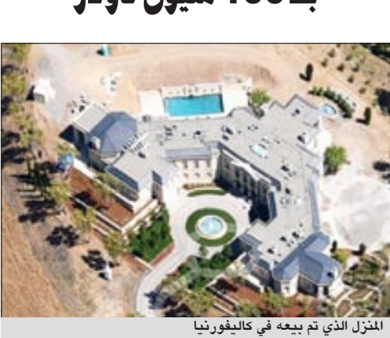
المنزل الذي تم بيعه في كاليفورنيا

واشنطن - يو.بي.أي: دفع الملياردير الروسي يوري ميلنر 100 مليون دولار ثمن منزل فخم في كاليفورنيا الأميركية وهو أعلى ثمن يسجل لمنزل في الولايات المتحدة.