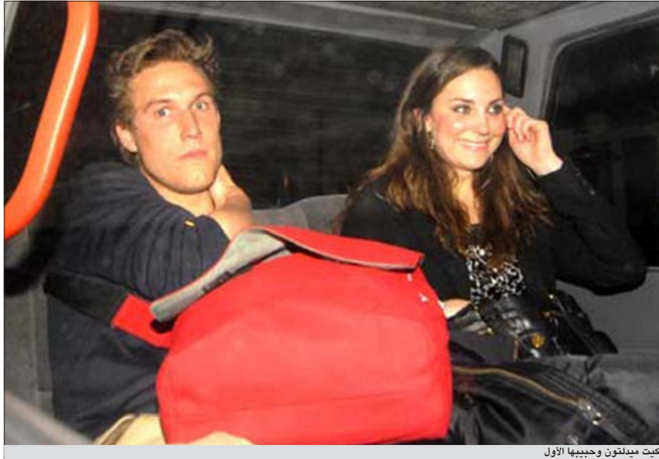
كيت ميدلتون وحبیبها الأول