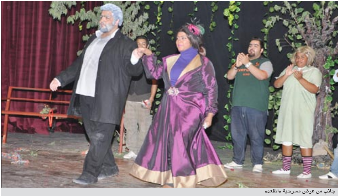
جانب من عرض مسرحية «المقعد»