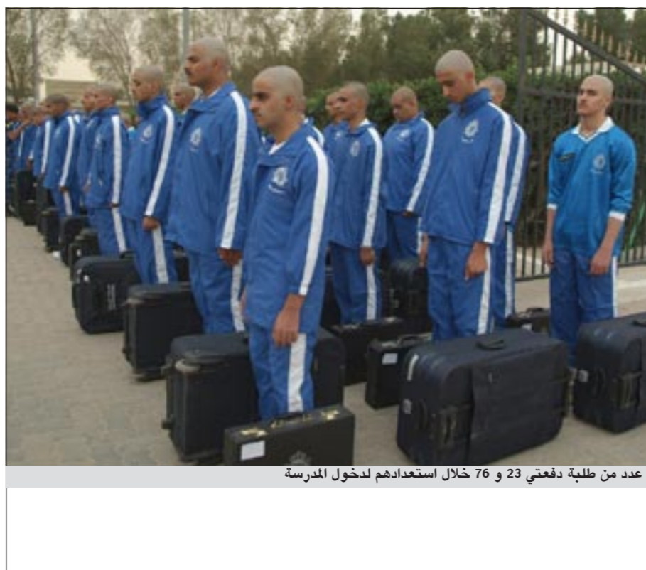
عدد من طلبة دفعتي 23 و 76 خلال استعدادهم لدخول المدرسة

برعاية مدير عام الادارة العامة لتأهيل ضباط الصف والافراد العميد خالد الجناحي، وحضور مساعد المدير العام العميد محمد عامر العجمي، وبإشراف مدير مدرسة الشرطة المقدم محمد بدر الرومي، استقبلت مدرسة الشرطة يوم امس الاول الدفعة 23 من رتبة وكيل عريف والدفعة 76 من رتبة شرطي والبالغ عددهم (404) طلاب وتستغرق الدورة اربعة اشهر دراسية منها ثلاثة اشهر داخل المدرسة وشهر ميداني قبل التخرج ويتم تدريس بعض المواد الشرعية والقانونية التي تؤهل الخريجين للقيام بواجبهم المناط بهم، بالإضافة الى دورات في اللغتين العربية والانجليزية، كما يتم خلال الدورة القاء العديد من المحاضرات المتنوعة التي تتعلق بطبيعة العمل.