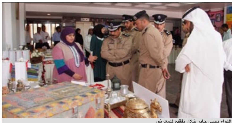
اللواء يحيى جابر خلال تفقده للمعرض

عن بر الوالدين، بالإضافة الى عرض البحوث السابقة التابعة للإدارة واتخذت شعاراً لها «أسرتي مأمني وراحتي». أما إدارة الإحصاء فقامت بالعديد من الأنشطة المتنوعة منها التعرف بالهمن الكويتية القديمة والتعلم قديماً وكذلك الألعاب، بالإضافة