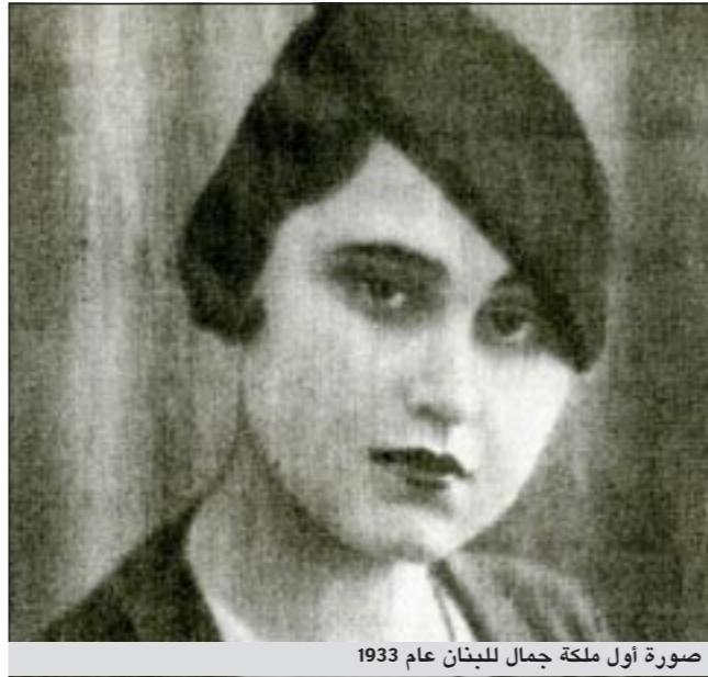
صورة أول ملكة جمال للبنان عام 1933