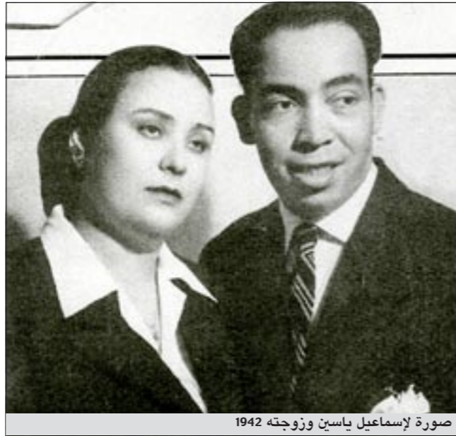
صورة لإسماعيل ياسين وزوجته 1942