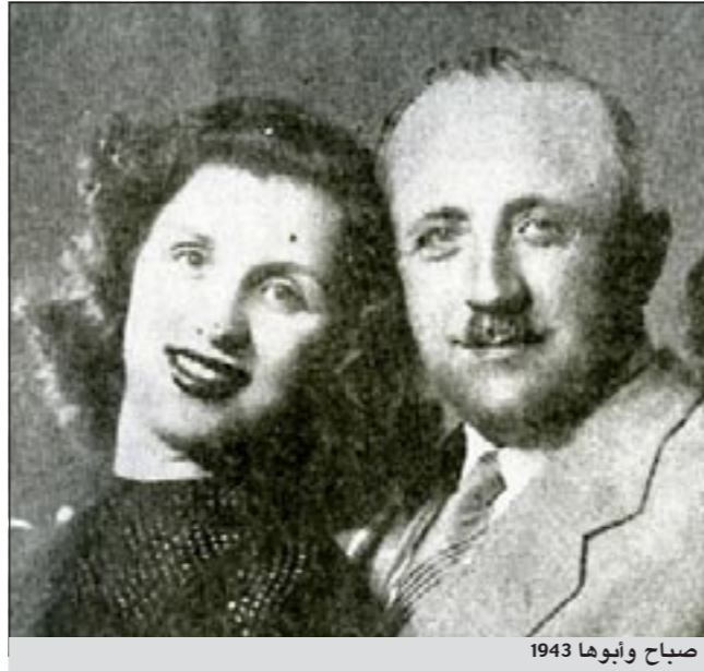
صباح وابوها 1943

وشينياً فشيئاً يتعلم كونستانتوبولوس كيف يطابق الإشارات الضوئية المختلفة بهذا الشكل أو ذلك.