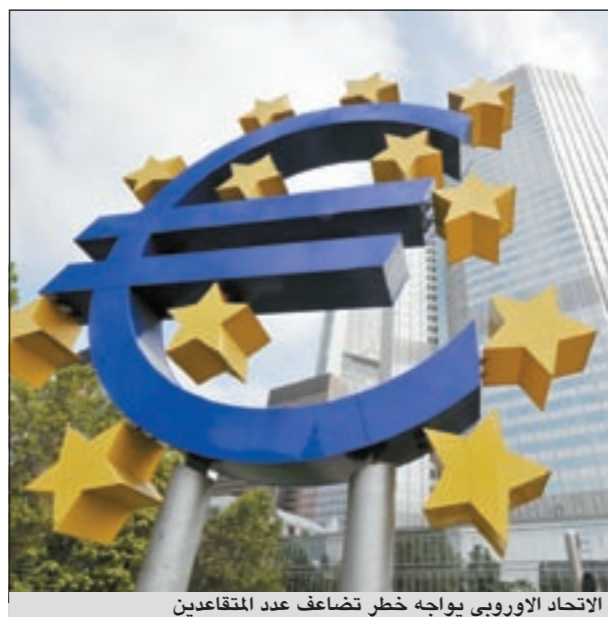
الاتحاد الأوروبي يواجه خطر تضاعف عدد المتقاعدين

ولم يقدم أندور اقتراحات محددة مثل رفع الحد الأدنى للمعاش وهو موضوع ذو حساسية سياسية تتم مناقشته في العديد من دول الاتحاد الأوروبي.