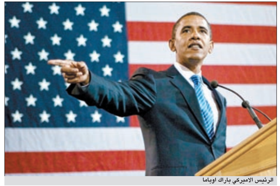
الرئيس الأميركي باراك أوباما

واشنطن يو.بي.آي: حث الرئيس الأميركي باراك أوباما أمس الأميركيين على الفطام عن النفط محذراً من أنه ليس هناك ما يكفي من النفط لسد حاجات البلاد على المدى الطويل. وقال أوباما في خطابه الإذاعي الأسبوعي إن الولايات المتحدة أنتجت العام الماضي نفطاً أكثر من أي عام سيق منذ سنة 2003 لكنه أضاف أن «الحقيقة هي أن التنقيب وحده ليس إستراتيجية حقيقية لمستيد اعتمادنا على النفط الأجنبي» لأن الولايات المتحدة لديها 2% من احتياطي النفط في العالم وتستخدم نحو 25% من النفط المنتج.