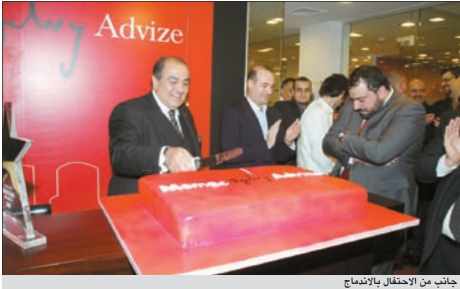
جانب من الاحتفال بالاندماج

الإبداعي، وفريقاً متكاملًا للعلاقات العامة، وأكثر من 60 موظفًا، كما ستم إضافة 3 دوائر جديدة إلى الشركة وهي: دائرة «أوجلفي ون» لإدارة الخدمات الرقمية وعلاقات العملاء والتسويق المباشر، ودائرة «أوجلفي أكشن» للخدمات التنشيط، بالإضافة إلى دائرة «سي بي آيه ميماك» للتصميم.