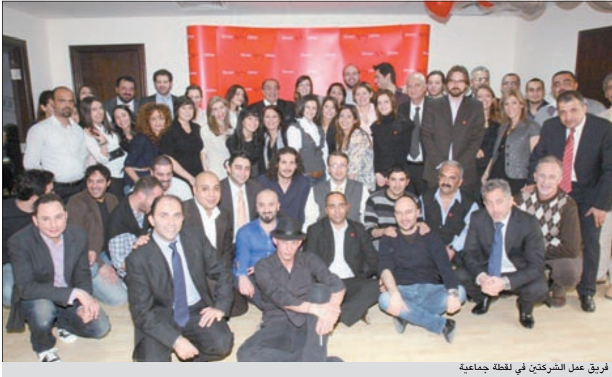
فريق عمل الشركتين في لقطة جماعية