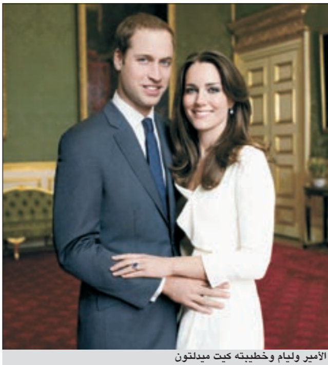
الأمير وليام وخليفته كيت ميدلتون

اقتراب موعد الزواج يورق نوم وليام «وركبته تصطكان»!