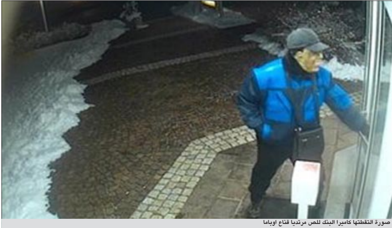
صورة التقطتها كاميرا البنك للص مرتديا قناع أوباما

كما يعرض المتحف نماذج من مخلفات البشرية منذ القرن الثامن عشر والتي تبين كيفية تغير سلوك البشر في تعاملهم مع الأشياء وكيفية تصرفه مع المخلفات التي يعود البعض منها الى القرن الثامن عشر مثل البطال الذي ارتداه صاحبه حتى تمزق وتم رتفه وبهتت الواه الى حين تم استخدامه لسد صدق كبير في الجدار لمنع تسرب الهواء البارد. هذا الى جانب عشرات الدمى التي كانت تلعب بها الفتيات السويديات خلال الطفولة، فضلا عن الفوط الصحية القطنية والصيني والسجاد وغيرها من متعلقات البشر.