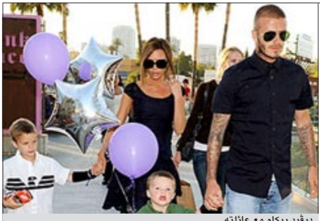
ديفيد بيكام مع عائلته

وترغب فيكتوريا في اطلاق اسم «كوكو» على ابنتها المنتظرة ولكن ديفيد يتصدي بكل قوته لرغبة زوجته اذ لا يرغب في ان تحمل ابنته الاولى اسم كلب.