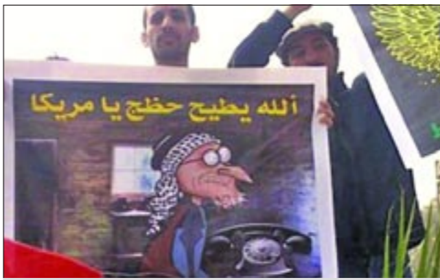
عراقي يحمل صورة شخصية ابو انعام الكرتونية خلال تايينه

وتثير الطريقة التي قُتل بها هذه الشخصية الشهيرة الكثير من التساؤلات، إذ اتهم بعض من أصدقاء أبو إنعام جهات لم يسموها بالضلع في قتله. وأشاروا إلى أن الهدف من القتل هو القضاء على شهرة شخص تخاف تلك الجهات من استغلال شهرته في السياسة.