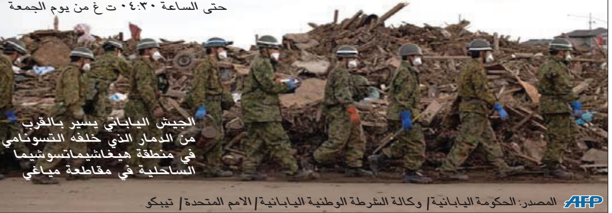
الجيش الياباني يسير بالقرب من الدمار الذي خلفه التسونامي في منطقة هيغاشيمياتسوشيما الساحلية في مقاطعة مياغي حتى الساعة ٠٤:٣٠ ت غ من يوم الجمعة