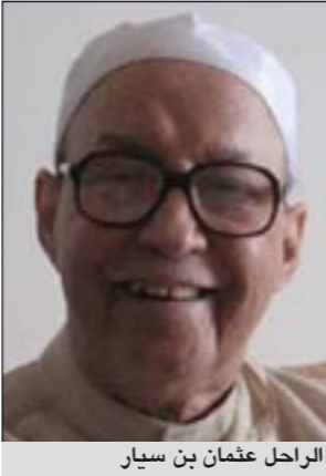
الراحل عثمان بن سيار

توفي ظهر الأربعاء، الشاعر السعودي الكبير عثمان بن سيار المحارب، خارج المملكة، ومن المتوقع وصول جثمانه إلى الرياض غداً حيث يصلي عليه في جامع الملك خالد بأم الحمام.