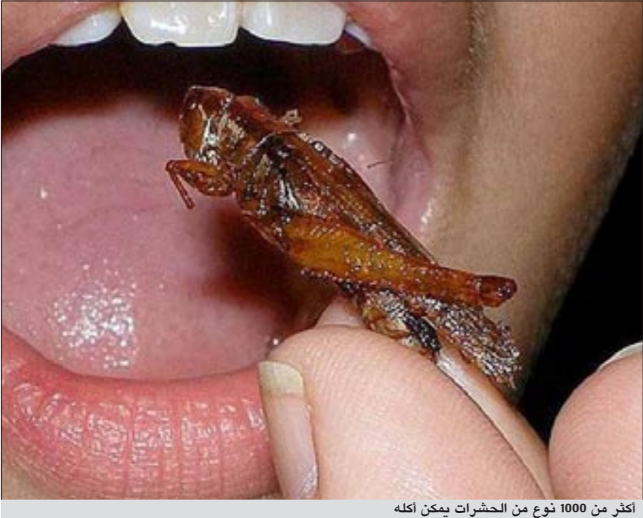
أكثر من 1000 نوع من الحشرات يمكن أكله

مائدة البيت الغربي. ويؤكل حالياً أكثر من 1000 نوع من الحشرات في 80٪ من دول العالم، غالبيتها بلدان مدارية. وتقول منظمة الأغذية والزراعة التابعة للأمم المتحدة أن الحشرات ضرورية لسد حاجة سكان العالم المتزايد عددهم الى الغذاء. ولكن الحشرات لا مكان لها عملياً في غذاء العديد من البلدان الغنية. وينطلق المشروع الذي يشارك في تنفيذه 70 باحثاً بقيادة البروفيسور ديك من واقع أن 80٪ من سكان العالم يستهلكون حشرات الآن، سواء أكانوا يعرفون ما يأكلون أو لا يعرفون.