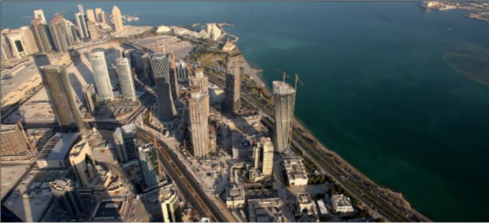
قطر ترفع موازنتها العامة بنسبة 27٪ عن العام الماضي