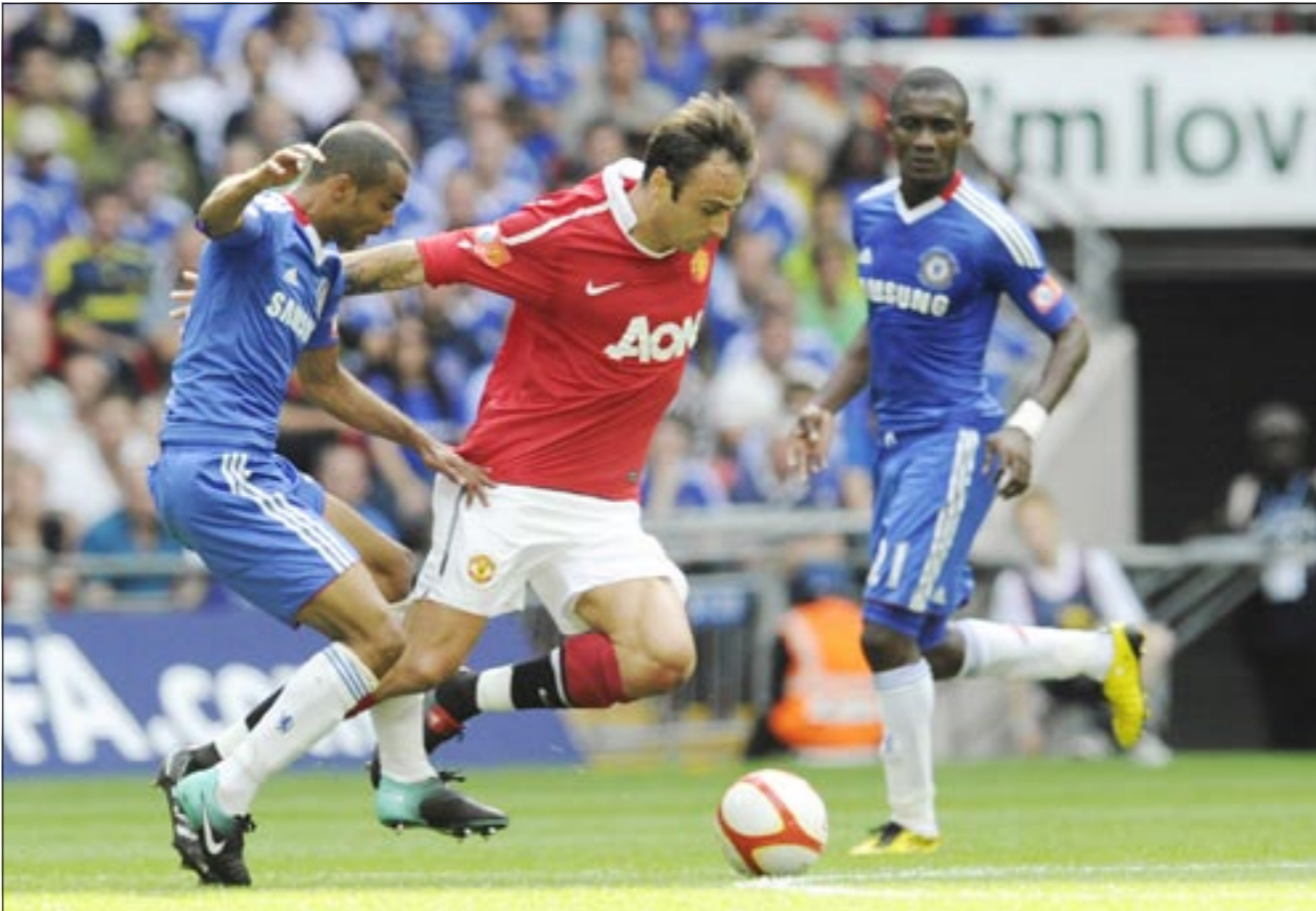
بايرن ميونخ يطالب نجم مان يونايتد البلغاري ديميتار برباتوف

في مفاوضات مع فريق الدرجة الثانية الألمانية ميونخ 1860 في محاولة لشراء حصة فيه. وذكرت الصحيفة ان المستثمرين الإماراتيين سيدفعون