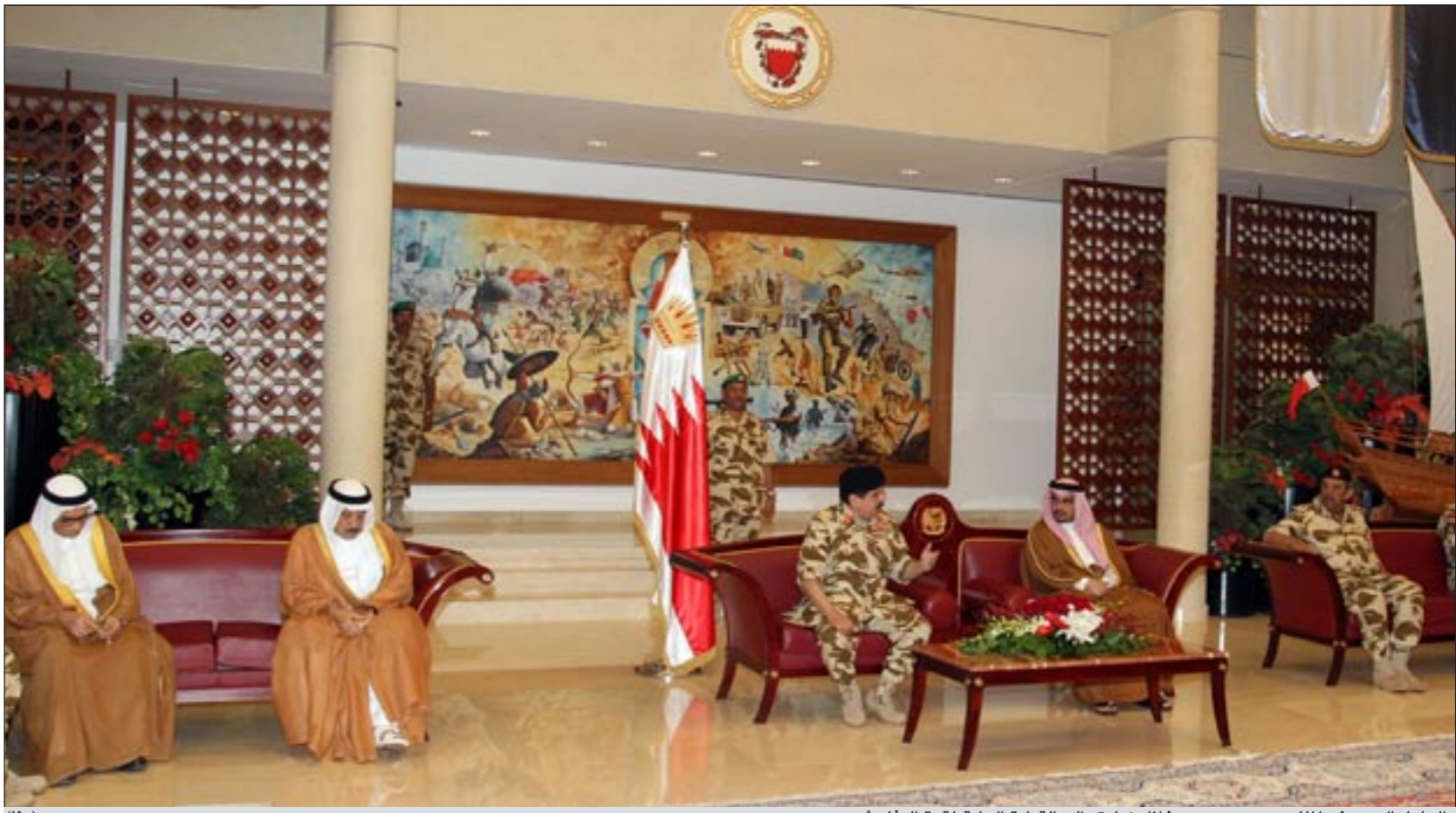
العاهل البحريني الملك حمد بن عيسى خلال زيارته إلى القيادة العامة لقوة الدفاع أمس

المنامة - بنا - كونا: دعت سفارتنا في مملكة البحرين طلبتنا الدارسين في البحرين الى ضرورة احضار الجداول الدراسية والهوية الجامعية كشرط لدخول المملكة. وازدادت السفارة في بيان صحافي امس ان المناقذ البحرينية تشترط اظهاار الهوية الجامعية والجداول الدراسي من الطلبة للسماح لهم بالدخول الى المملكة.