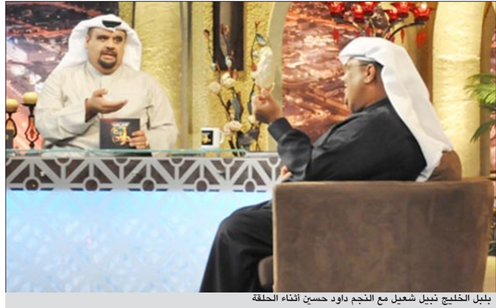
بلبل الخليج نبيل شعيل مع النجم داود حسين أثناء الحلقة

كوميدي يجتمع حوله جميع أفراد الأسرة العربية ويستضيف داود في الحلقة الأولى من البرنامج، نبيل شعيل والنجم داود حسين، والتي تعد