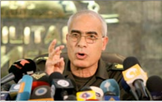
الواء ممدوح شاهين عضو المجلس الاعلى للقوات المسلحة في مؤتمر صحفي امس

وحدد هذا الاعلان ثمانية صلاحيات للرئيس أبرزها «تعيين الأعضاء المعيّنين في مجلس الشعب، دعوة مجلسي الشعب والشورى لانتقاد دورته العادية وفضها والدعوة لاجتماع غير عادي وفضه، حق إصدار القوانين أو الاعتراض عليها، تمثيل الدولة في الداخل والخارج وإبرام المعاهدات والاتفاقيات الدولية، تعيين رئيس مجلس الوزراء ونوابه والوزراء ونوابهم وإعاقوهم من مناصبهم، تعيين الموظفين المدنيين والعسكريين والمثليين السياسيين وعزلهم على الوجه المبين في القانون، واعتماد ممثلي الدول الأجنبية السياسيين».