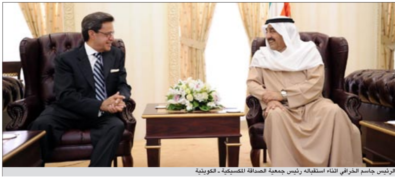
الرئيس جاسم الخرافي اثناء استقباله رئيس جمعية الصداقة المسيكية - الكويتية

واستقبل رئيس مجلس الأمة جاسم الخرافي في مكتبه ظهر امس رئيس جمعية الصداقة المسيكية - الكويتية كارلوس بيرالنا والوفد المرافق له. حضر اللقاء رئيس بعثة الشرف المرافقة للوفد الضيف الوكيل بديوان سمو رئيس مجلس الوزراء خالد النباي. جرى خلال اللقاء بحث العلاقات الثنائية بين البلدين الصديقين وسبل تطويرها وآخر المستجدات على الساحتين الاقليمية والدولية.