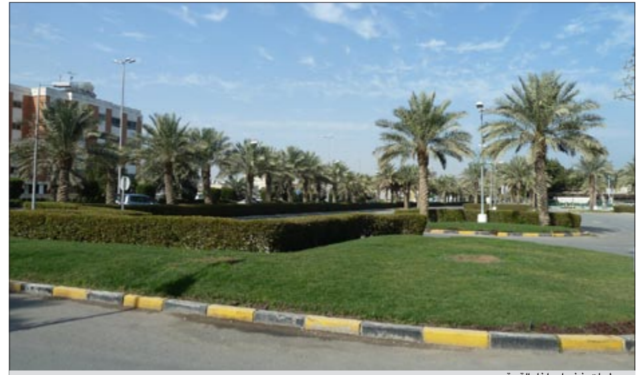
مساحات خضراء داخل القرية

أوقات الزيارة: 9:30 صباحا إلى 1:00 ظهراً 4:30 عصراً إلى 9:30 مساءً يوم الجمعة، 4:30 عصراً إلى 10:30 مساءً