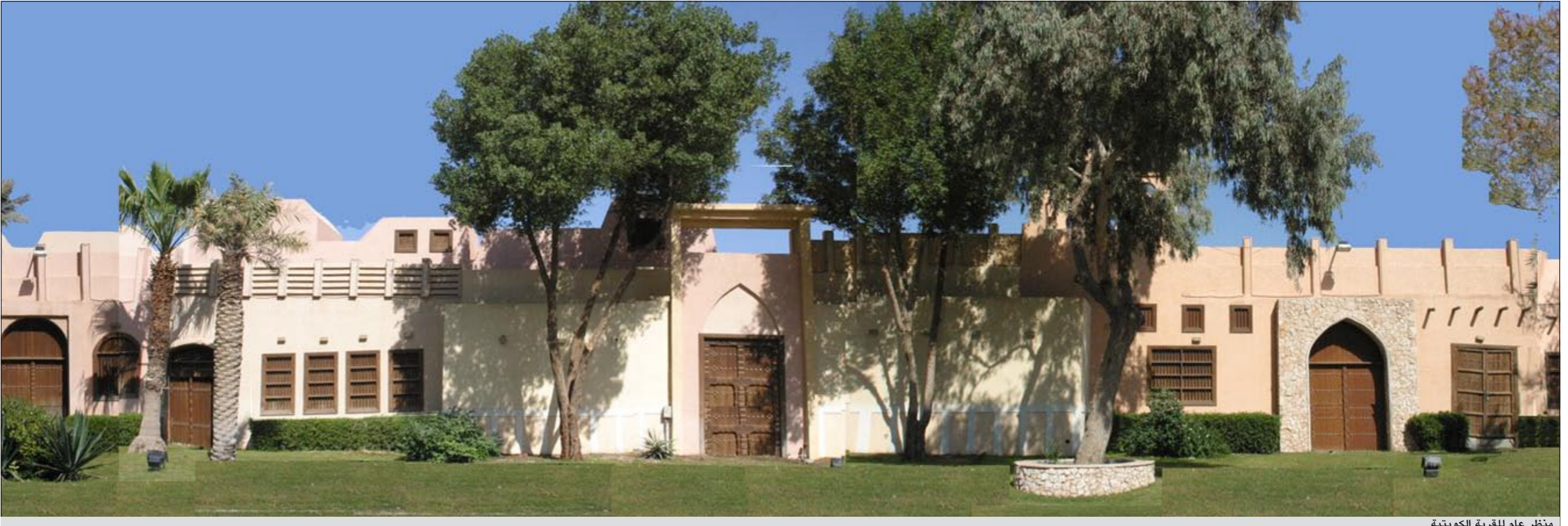
منظر عام للقرية الكويتية