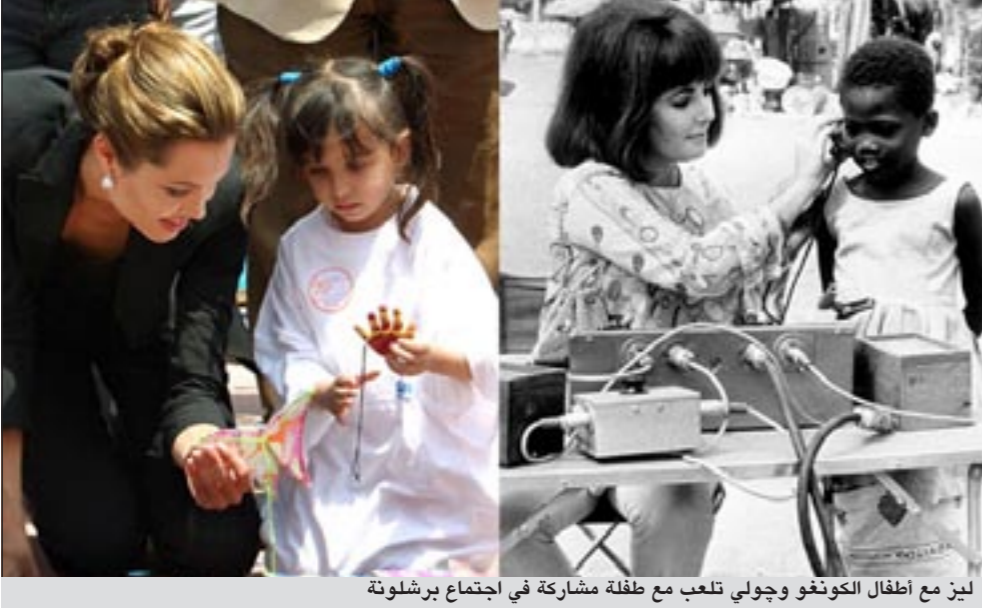
لين مع أطفال الكونغو وجولي تلعب مع طفلة مشاركة في اجتماع برشلونة