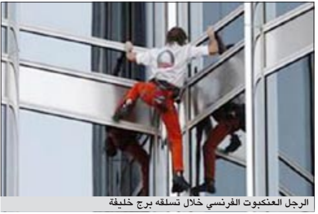
الرجل العنكبوت الفرنسي خلال تسلقه برج خليفة

وأضاف أن «جزءا من رسالتي هو ليس القيام بما يقوله لكم