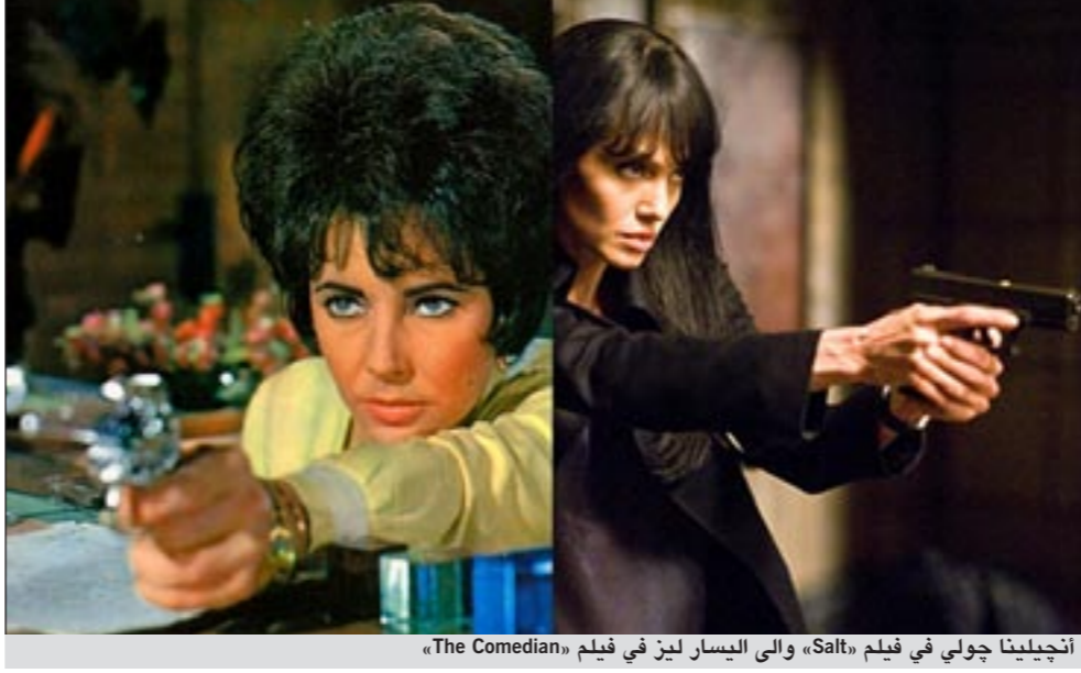
أنجلينا جولي في فيلم «Salt» والى اليسار لين في فيلم «The Comedian»

القاهرة - إم.بي.سي: جمعت كثير من أوجه التشابه بين كل من النجمة أنجلينا جولي وقطة هوليوود الراحلة «إيزابيث تايلور»، فإضافة إلى الجمال الخلاب الذي ميز كلتا النجمتين، توافقت حياتهما بشكل لافت للفتن.