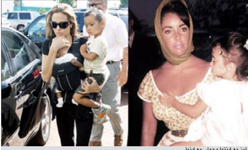
لين مع ابنتها وجولي مع ابنتها