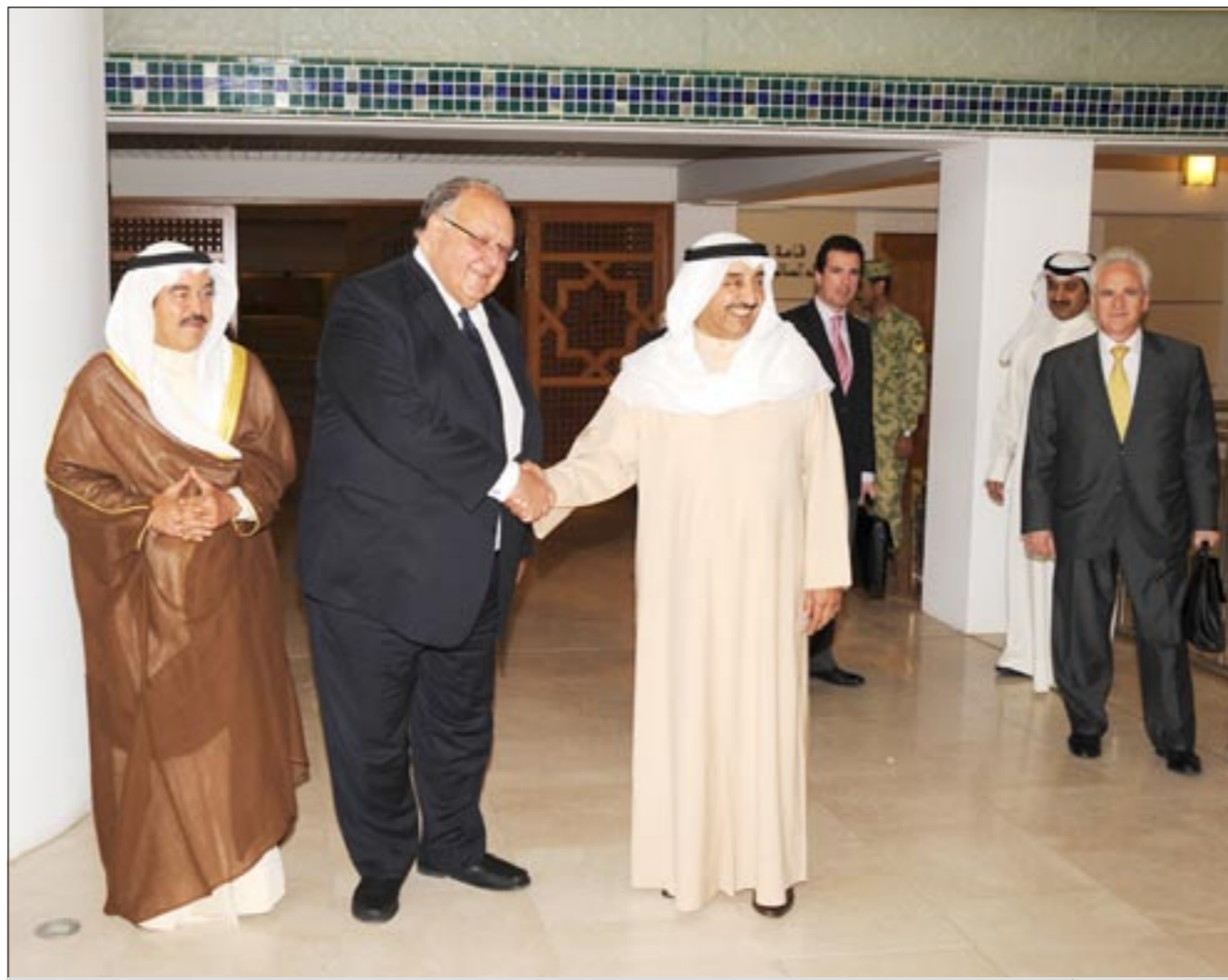
الرئيس جاسم الخرافي مرحباً برئيس وزراء اليونان بحضور الشيخ سالم الجابر (هاني الشمري)

في جمهورية إيران الإسلامية معالي د.علي لاريجاني، كما استقبل الخرافي نائب رئيس وزراء جمهورية اليونان ثيودوروس بانغالوس، تم خلال اللقاء مناقشة القضايا ذات الاهتمام المشترك بين الدولتين