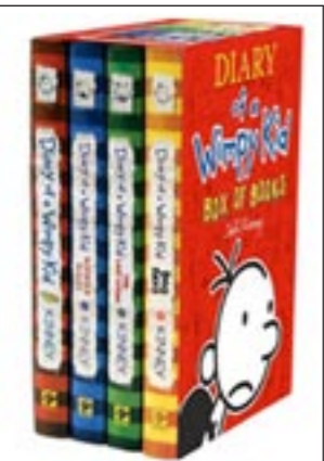
الجزء الثاني من «دياري أوف أويمبي كيد» يتصدر شبكات التذاكر في أميركا الشمالية

وهو من بطولة ماتيو ماكغونوغي وماريزا تومبي حول قصة محام ناجح يعمل من المقعد الخلفي لسيارة ليكتولن قديمة. وحقق 11 مليون دولار. تلاه في المرتبة الخامسة، فيلم الرسوم المتحركة «رانغو» عن حياء تحلم بأن تصبح بطلا مع صوت جوني ديب. وجمع هذا الفيلم 9,8 ملايين دولار. في المرتبة الخامسة حل فيلم «باتل: لوس أنجيليس»، الذي تواجه فيه قوات المارينز عدوا غامضا اتى ليغزو الأرض. وجمع الفيلم 7,6 ملايين دولار. وحل سابعاً فيلم الخيال العلمي «بول» الذي جمع 7,5 ملايين دولار. وجاء في المرتبة الثامنة «ريد رايدنج هود» من بطولة كاترين هارديك المستوحى من القصة الخيالية الشهيرة «ليلي والذئب»، جامعا 4,4 ملايين. أما المرتبة التاسعة فكانت لفيلم «ذا دجاستنمنت بورو» من بطولة مات دابون، الذي