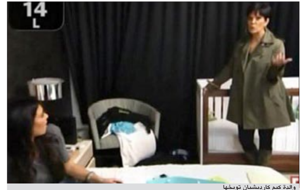
والدة كيم كارديشيان توبخها

وكالات: بالرغم من بلوغها عمر الـ 30 وامتلاكها ثروة هائلة من وراء امبراطوريتها في الاعلانات والملابس والطور وغيرها من المنتجات إلا ان نجمة المجتمع كيم كارديشيان مازالت بحاجة الى اذن من والدتها والتي هي أيضاً مدبرة أعمالها للسماع لها بحضور الحفلات. حيث ظهرت كيم في حلقة جديدة من برنامجها الواقعي في مشادة مع والدتها كريس جينر بعد ان قالت كيم انها تريد حضور حفلة اقامها زوج