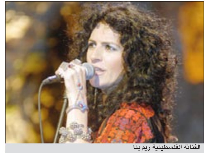
الفنانة الفلسطينية ريم بنا

عمان - رويترز: أحييت الفنانة الفلسطينية ريم بنا حفلاً بالعاصمة الأردنية عمان. وولدت ريم بنا في بلدة الناصرة وتعتبر سفيرة حقيقية للفلسطينيين بغناياتها التي تعبر عن ثقافة وتراث وتاريخ الشعب الفلسطيني. وذكرت ريم أن محنة الفلسطينيين ربما تكون معروفة للجميع خاصة في العالم العربي لكن من المفيد تذكرها على الدوام. وقالت الفنانة «هناك هدف