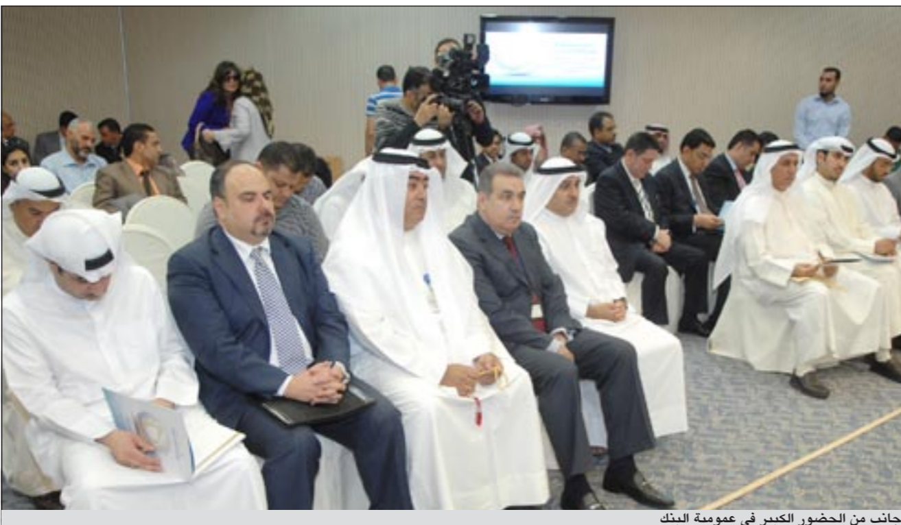
جانب من الحضور الكبير في عمومية البنك